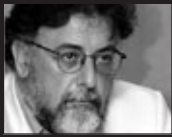
Του Γιάννη Πανούση, καθηγητή Εγκληματολογί- ας στο Πανεπι- στήμιο Αθηνών