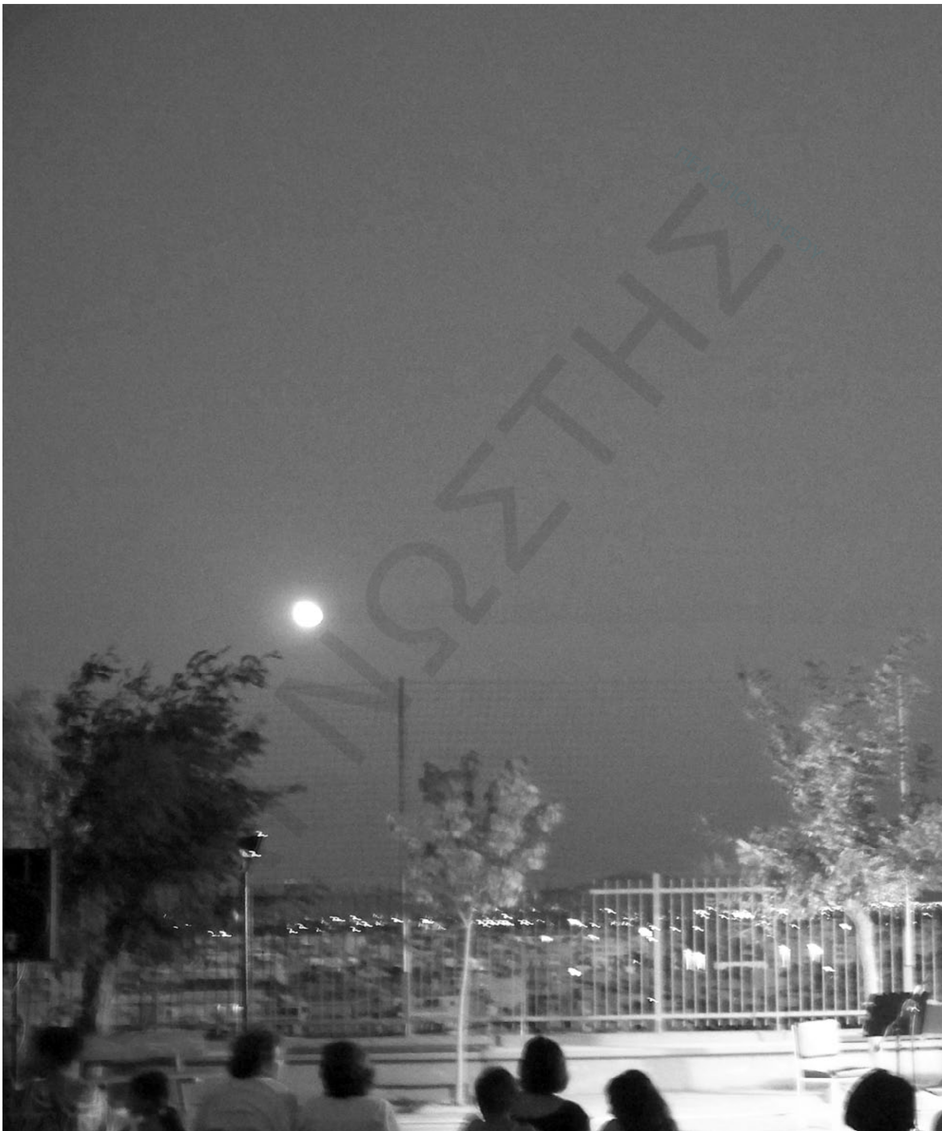
Αυτή τη φορά το φεγγαράκι έλαμψε πάνω απ το αργεϊτικό κάμπο για τους ρομαντικούς απ το 3ο δημοτικό σχολείο Άργους