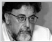
Του Γιάννη Πανούση, καθηγητή Εγκληματολογίας στο Πανεπιστήμιο Αθηνών

Σπάνε ένα – ένα τα αποστήματα της Μεταπολίτευσης. Ανήκω ηλικιακά σ' αυτή