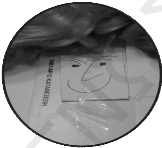
ΕΝΑ ΠΑΙΔΙΚΟ ΚΟΥΡΕΜΑ.....