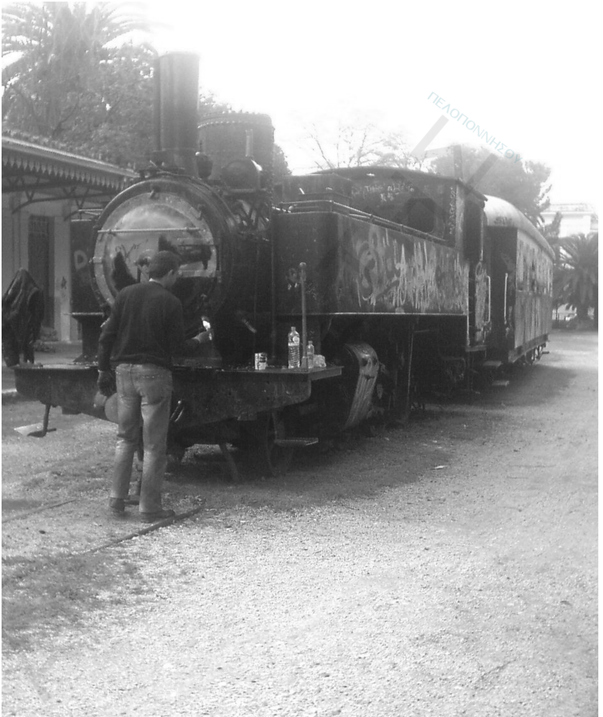
Το πιο σύντομο ανέκδοτο: Έρχεται το τρένο...