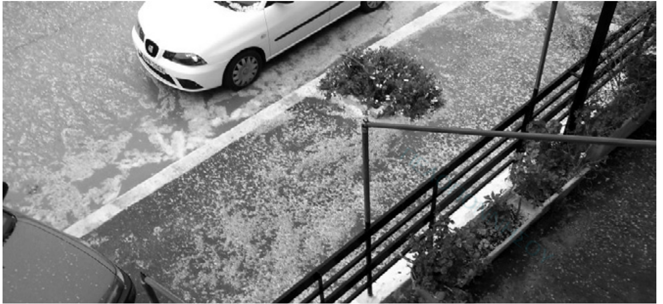
Δεκάδες φωτογραφίες στο διαδίκτυο, από την χαλαζόπτωση σε Ναύπλιο, Άργος, Ν. Κίο