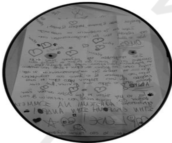
Φόβισε τον φόβο ....

Έφυγε για την δουλειά του και ακολούθησε τις στερεοτυπικές κινήσεις που κάνει κάθε πρωί. Άνοιξε τις πόρτες, έφτιαξε τον καφέ του, άνοιξε το ηλεκτρονικό ταχυδρομείο, πίεσε το κουμπί έναρξης στο μικρό μαύρο ραδιοφωνάκι να ακούσει το δελτίο ειδήσεων και άδειασε τις τσέπες του από το μικροπράγματα που κουβαλούσε, κλειδιά κινητά. Στην αριστερή τσέπη του σακακιού του έπιασε ένα διπλωμένο χαρτί. Το έβγαλε έκπληκτος. Ήταν ένα χαρτί Α4 διπλωμένο πολλές φορές κατά μήκος, ένα γράμμα από την κόρη του!!! Το ακούμπησε στον φάκελο του μικρού παιδιού για το οποίο είχε την τελευταία συνάντηση χτες βράδυ με τους γονείς του. Άνοιξε το γεμάτο καρδούλες γράμμα.