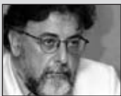
Του Γιάννη Πανούση, καθηγητή Εγκληματολογίας στο Πανεπιστήμιο Αθηνών

Πως αντιμετωπίζουμε την κρίση; Με ποιος όρους: