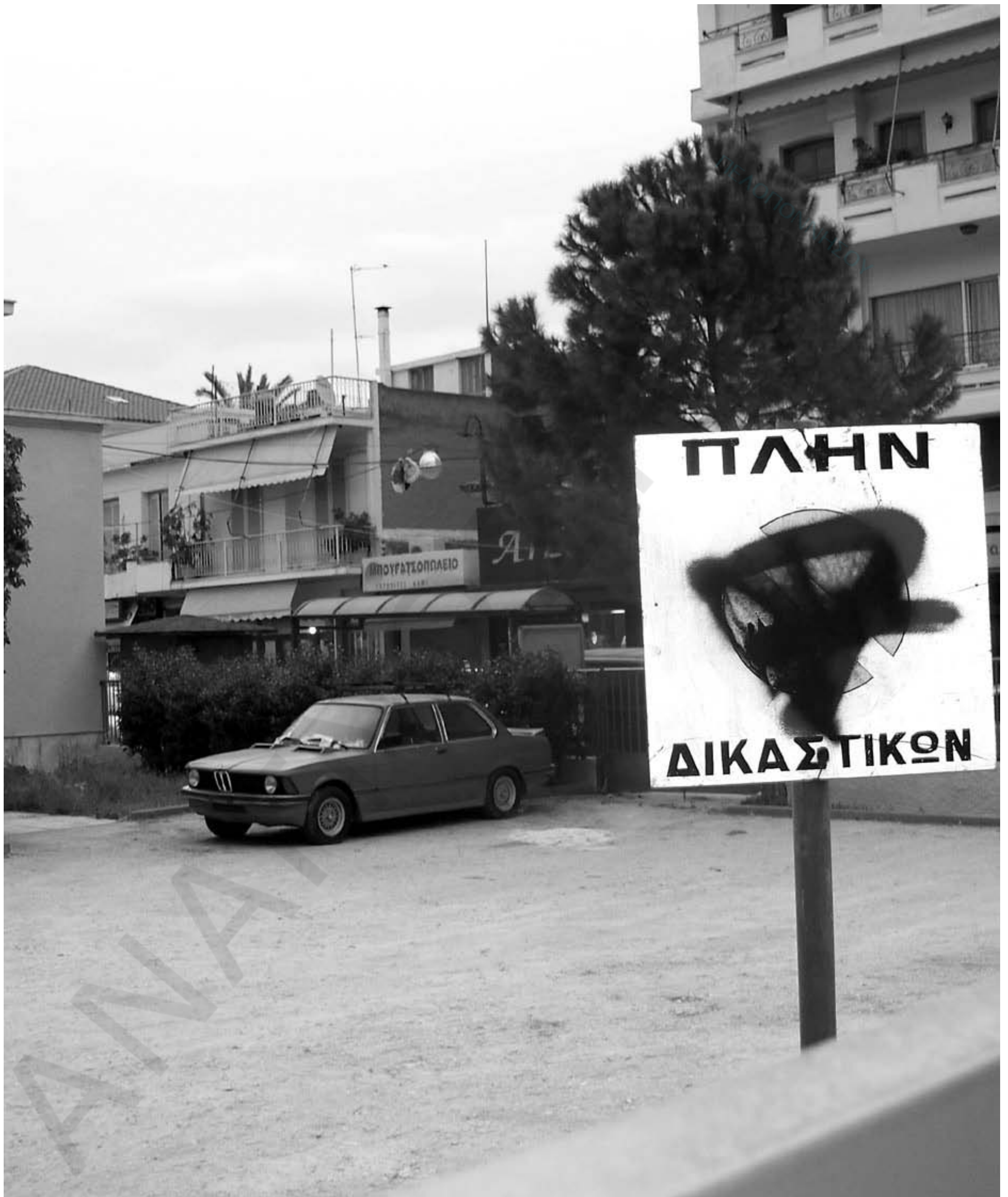
Επιτέλους μετά από δικαστικές διαμάχες απέκτησε το Άργος νεκροταφείο αυτοκινήτων στο κέντρο της πόλης