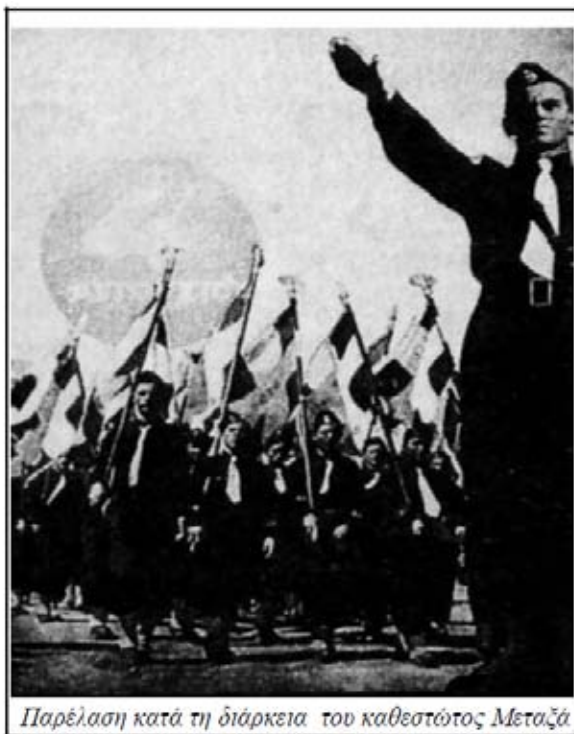
Παρέλαση κατά τη διάρκεια του καθεστώτος Μεταξά

• Οι Έλληνες δεν έχουν παρόμοια προβλήματα με αυτά των Κυπρίων, αφού όχι μόνο δεν έχουν καταθέσεις, αλλά ούτε καν εισόδημα! Παρόλα αυτά επιδεικνύουν και αυτοί ζηλευτή ψυχραιμία και δουλικότητα τα τελευταία χρόνια, σε οτιδήποτε ισοπεδώνει τα κοινωνικά και οικονομικά τους κεκτημένα και κυρίως την αξιοπρέπεια τους.