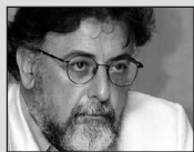
Του Γιάννη Πανούση, καθηγητή Εγκληματολογίας στο Πανεπιστήμιο Αθηνών

1. Η Ελλάδα είναι ένα απομονωμένο – λόγω οικονομικής κρίσης Έθνος-Κράτος ή η μοναδική χώρα μέλος της Ε.Ε δίχως δική της πολυδιάστατη εξωτερική πολιτική;