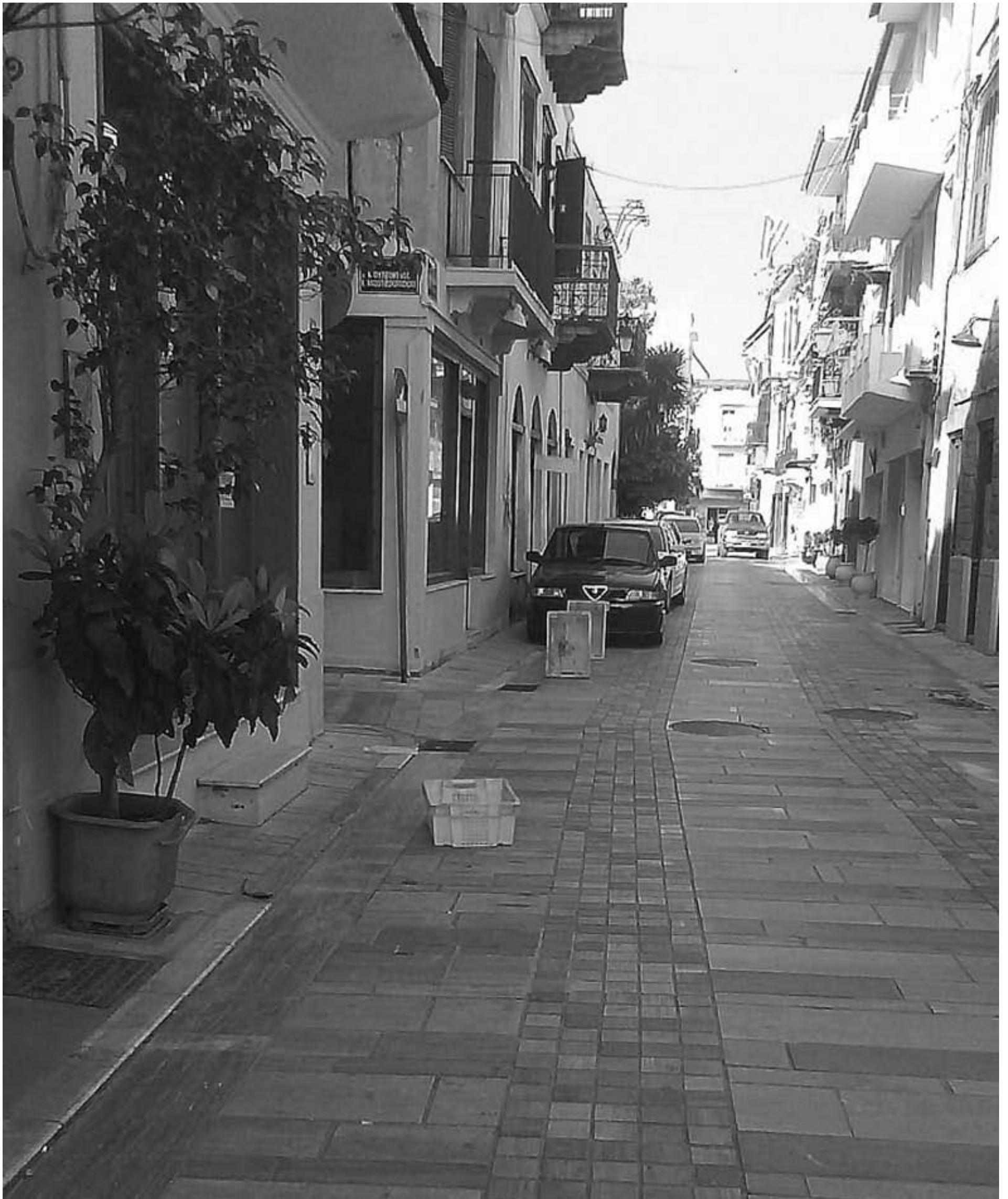
Επιτέλους, ο πολιτισμός του τελάρου του Άργους μεταδόθηκε και στο Ναύπλιο