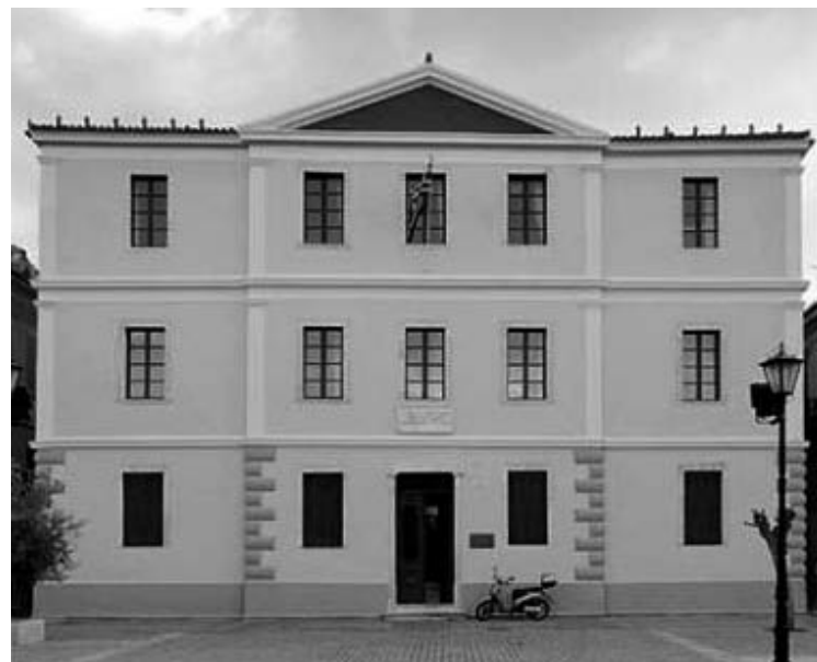
χρόνο των νέων επαγγελματιών του Δήμου.

Παράλληλα, αποφασίσθηκε η απαλλαγή από τα τέλη για τα άτομα με αναπηρίες, τους τρίτεκνους και πολύτεκνους του δήμου καθώς και απαλλαγή για ένα