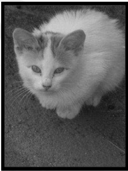
ΧΑΙΡΕ ΚΡΑΤΟΣ .....