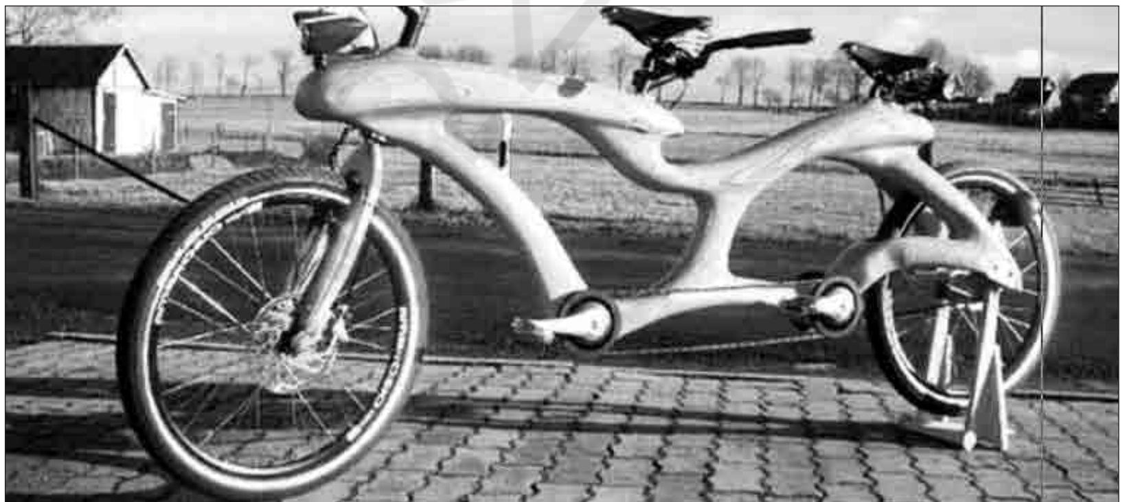
Για upper class... ξενόφερτους επαρχιώτες!