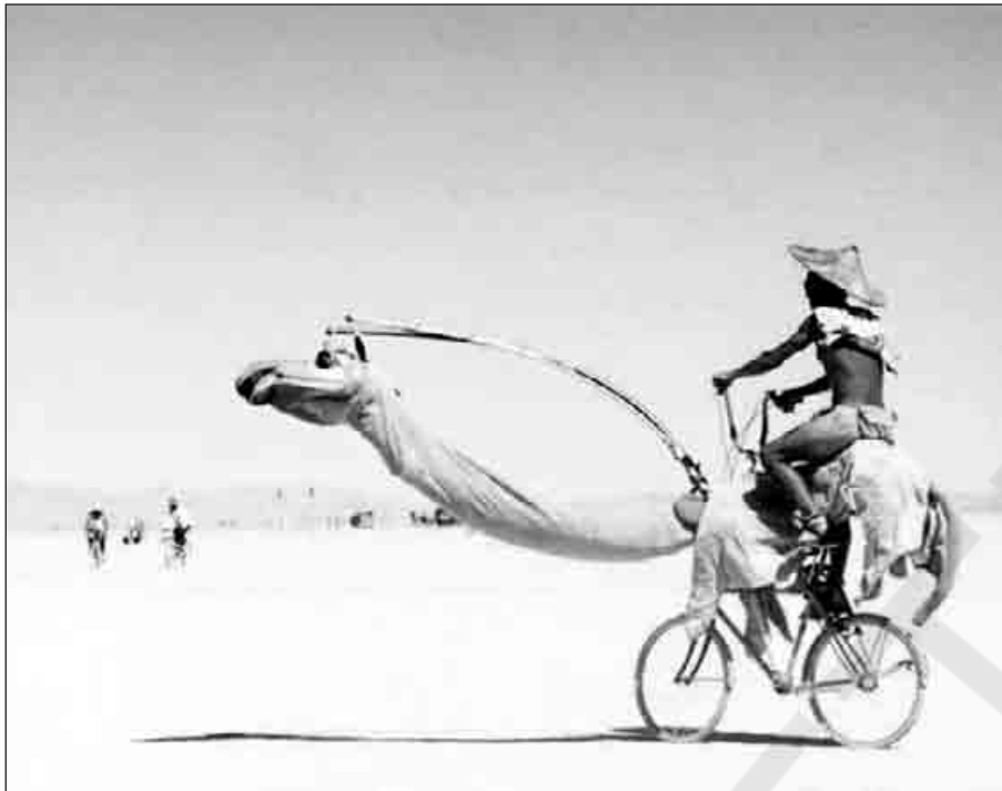
Αντικαθιστώντας την καμήλα, πάντα με σεβασμό στην παράδοση του τόπου...

Δεν υπάρχει συγκεκριμένη χρονολογία στην οποία να αποδίδεται η εφεύρεση του ποδηλάτου, επομένως ούτε συγκεκριμένος «εφευρέτης», αν και το πρώτο ποδήλατο εμφανίστηκε περίπου το 19ο αιώνα, αντανακλώντας την πεποίθηση των οπαδών της ότι θα αντικαθιστούσε το βασικό μεταφορικό μέσο της εποχής, το άλογο. Με το πέρασμα των χρόνων, ένα ποικίλο φάσμα δίτροχων «οχημάτων» πρόσφερε στους «οπαδούς» του τη δυνατότητα επιλογής, ενώ δεν ήταν λίγα αυτά που δημιουργήθηκαν για ξεχωριστούς... τύπους, προκαλώντας τα βλέμματα με την εμφάνισή τους.