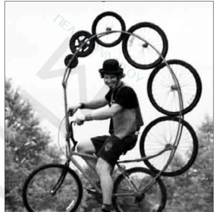
Ενσωματωμένες και οι ρεζέρβες...