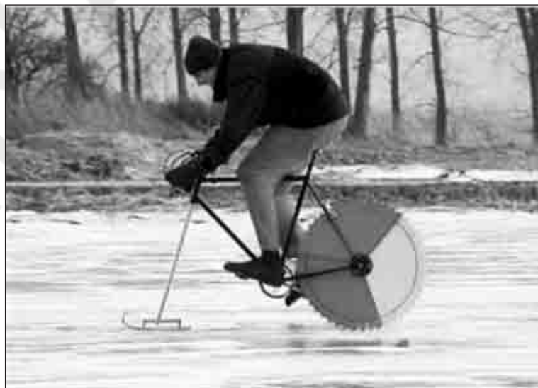
Για τους «ψυχρούς» τύπους του βορρά...