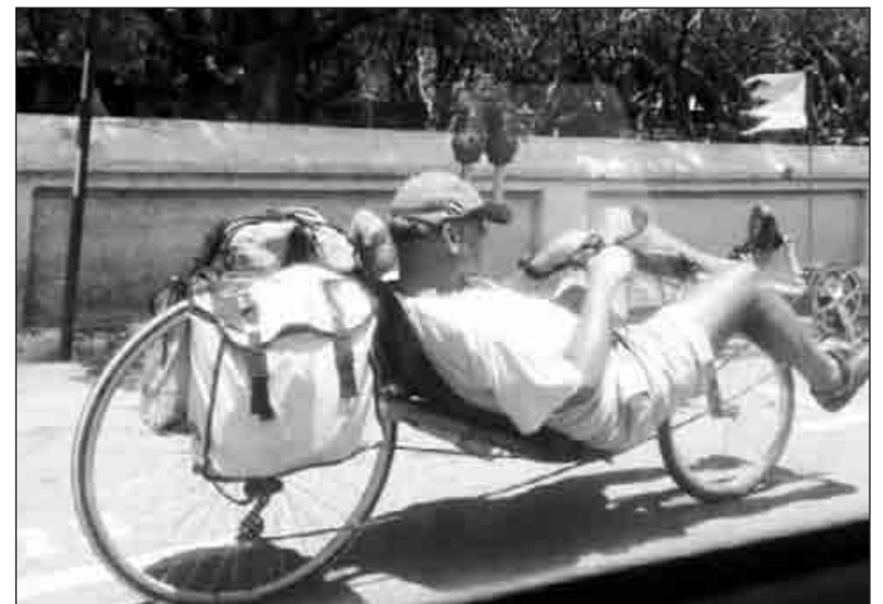
Για τους λάτρεις του κάμπινγκ...