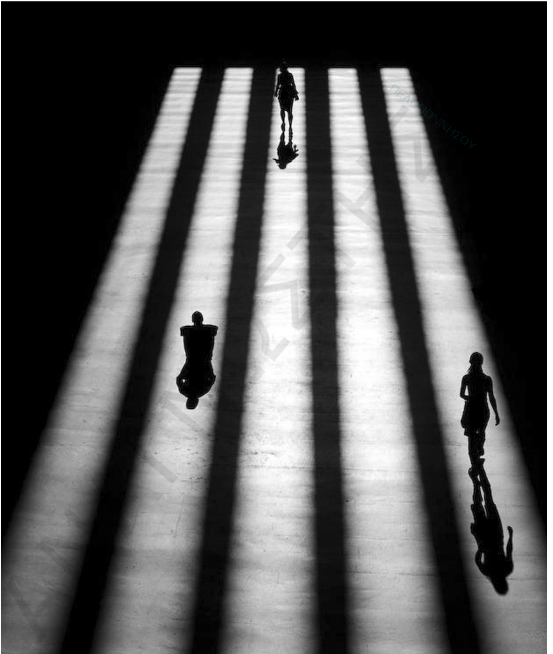
Χάραξη πορείας της Ελληνικής οικονομίας