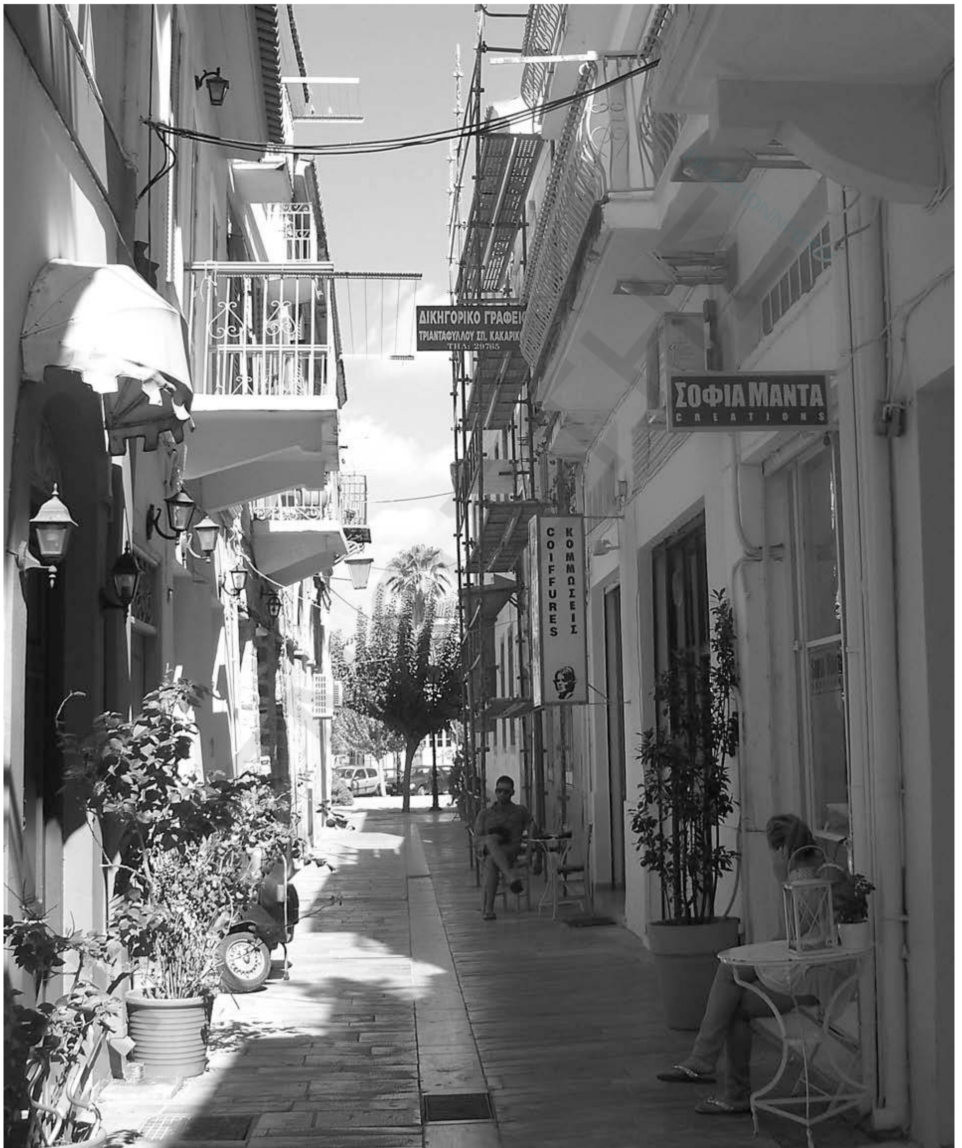
Σε έμβλημα της παλιάς πόλης του Ναυπλίου τείνουν να γίνουν οι "ξεχασμένες σκαλωσιές" στα σοκάκια της πόλης