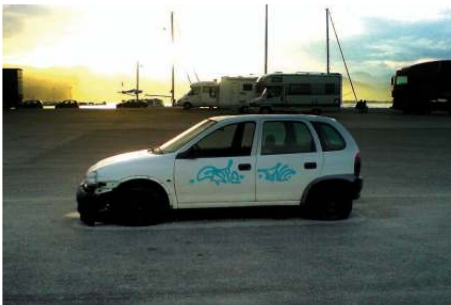
Το λευκό δίπορτο αυτοκίνητο (μάλλον μάρκας Opel) έχει πλέον σπασμένα παράθυρα, σκασμένα λάστιχα, σπασμένους προφυλακτήρες, ενώ στις πόρτες του έχουν γράψει συνθήματα και έχουν ζωγραφίσει με σπρέι.