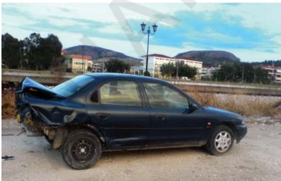
Το μπλε Ford είναι τρακαρισμένο από πίσω και στέκεται περιμένοντας τον μάστορα δίπλα στις γραμμές του τρένου

της ...παρέας αφίχθη τις τελευταίες ημέρες. Ίσως να είναι και προσωρινά σταθμευμένο εκεί – ο καιρός θα δείξει... Το μπλε Ford είναι τρακαρισμένο από πίσω και στέκεται περιμένοντας τον μάστορα δίπλα στις γραμμές του τρένου. Από το Λιμενικό Ταμείο ενημερωθήκαμε ότι άμεσα πρόκειται να ειδοποιηθούν οι ιδιοκτήτες των αυτοκινήτων αυτών με ειδοποίηση η οποία επικολλάται στο παρμπρίζ. Θα έχουν περιθώριο κάτι περισσότερο από έναν μήνα να απομακρύνουν τα σαραβαλάκια. Αλλιώς θα αναλάβει ο δήμος να τα στείλει για ανακύκλωση.