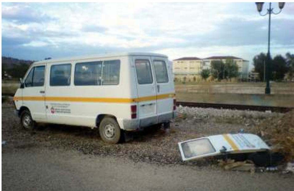
Κάποιος φωστήρας του Υπουργείου Υγείας προφανώς έκρινε ότι έχει μεγάλη γραφειοκρατία η ανακύκλωση και προτίμησε να εγκαταλείψει το βανάκι στο λιμάνι