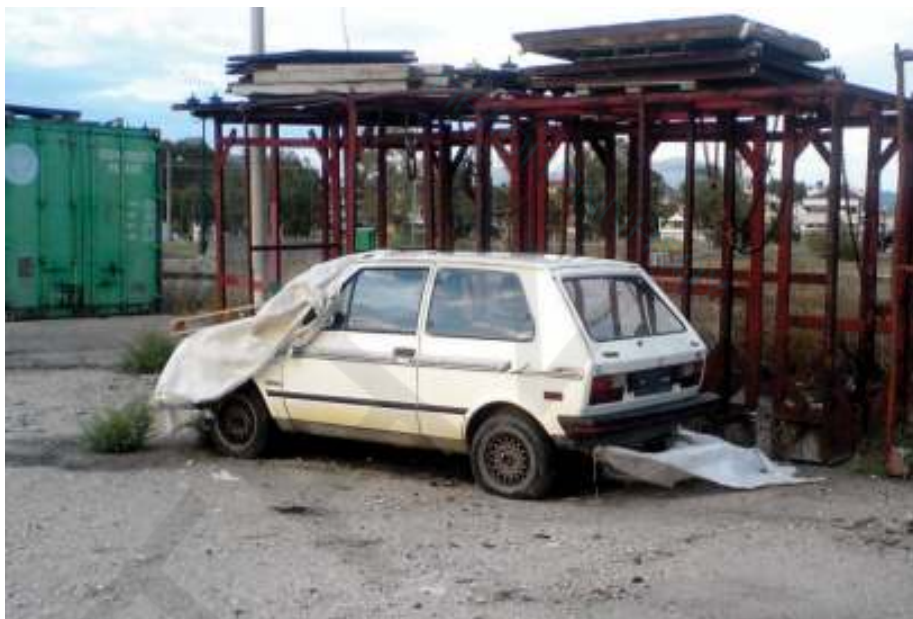
«Μουσειακό είδος» ίσως σε άλλη περίπτωση να μπορούσε να αποτελέσει ένα παμπάλαιο Zastava Yugo χωρίς πινακίδες, το οποίο ...κείται νεκρό δίπλα σε κάτι παλιοσίδερα

Σε νεκροταφείο αυτοκινήτων κινδυνεύει να μετατραπεί το λιμάνι του Ναυπλίου, αφού αυξάνονται καθημερινά τα εγκαταλειμμένα αυτοκίνητα που πλαισιώνουν την ασχήμια με τα μόνιμα εγκαταστημένα γιγάντια μηχανήματα – εξαρτήματα που βρίσκονται εκεί από την εποχή που μεταφέρονταν αδρανή. Η εικόνα –όπως φαίνεται και στις φωτογραφίες – είναι λυπηρή και σε καμία περίπτωση δεν αρμόζει στο λιμάνι της Πρώτης Πρωτεύουσας. Άλλωστε το λιμάνι του Ναυπλίου εκτός από το γεγονός ότι αποτελεί την πρώτη εικόνα των επισκεπτών της πόλης που έρχονται από την παραλιακή Νέας Κίου, ή από τις