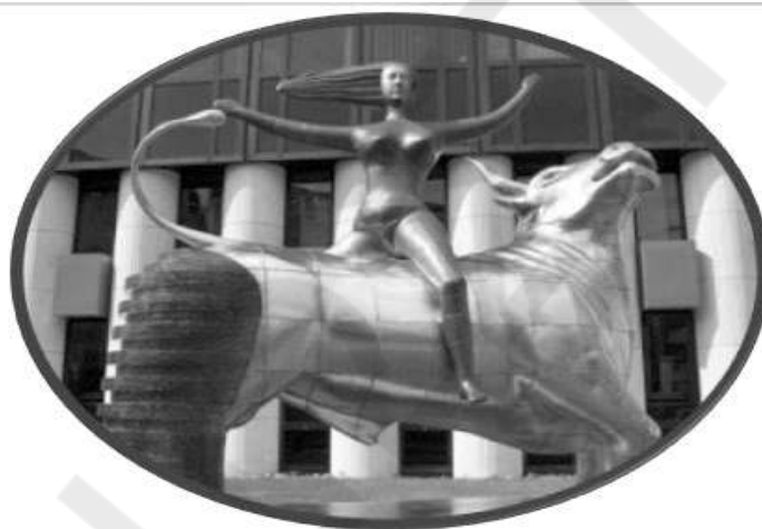
Ν & Π ΣΩΤΗΡΙΑΔΗ « Η ΑΡΠΑΓΗ ΤΗΣ ΕΥΡΩΠΗΣ »

*Η ιστορία είναι φανταστική αλλά στην δημιουργία της βοήθησε μια ατάκα του Χρήστου στο ψητοπωλείο «- η κορκολεκομψή και το γαϊδούρι»