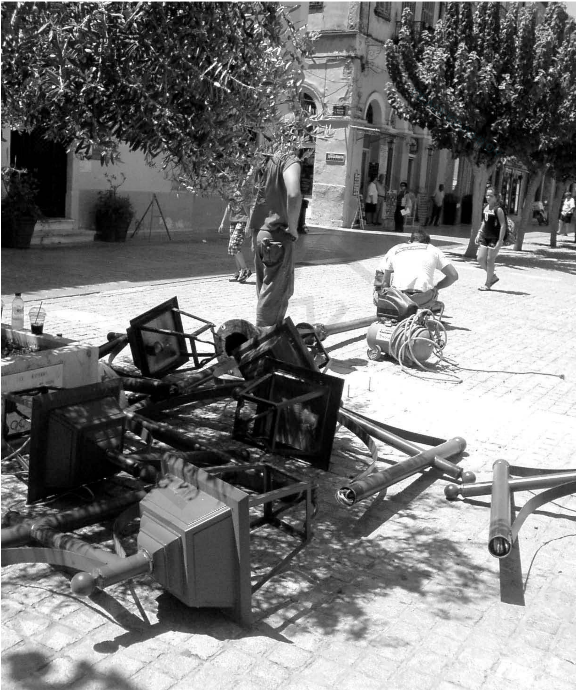
Μας άλλαξε τα φώτα ο Κωστούρος