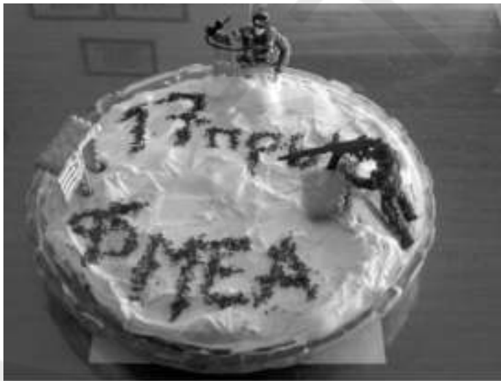
ΜΕ ΑΦΟΡΜΗ ΜΙΑ ΣΥΝΑΝΤΗΣΗ 17 ΧΡΟΝΙΑ ΜΕΤΑ....