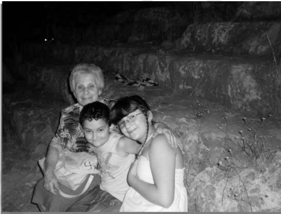
Με την γιαγιά στα «σκαλάκια», το Αρχαίο Θέατρο Άργους