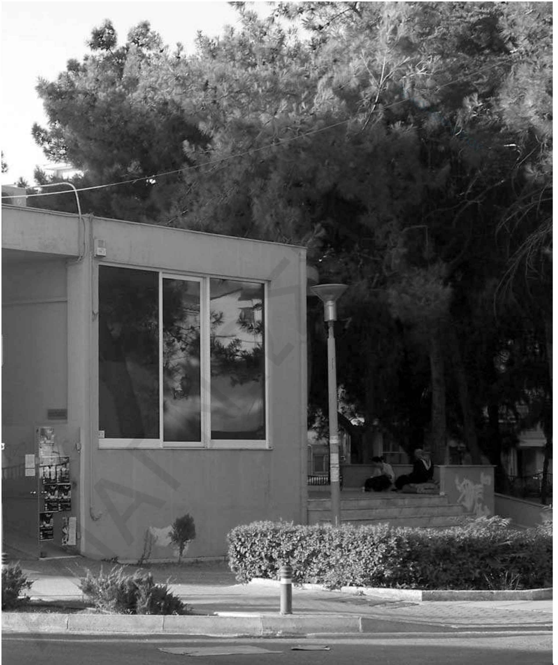
Δίκλινο ή τετράκλινο; Κρατήσεις στην δημοτική αστυνομία Άργους-Μυκηνών