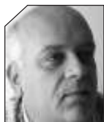
του Ακη Γκάτζου

ΚΑΙ ΤΙ ΑΛΛΑΞΕ με τις δύο εκλογικές αναμετρήσεις; Δυο μήνες μείναμε πίσω για να συνεχιστεί η διακυβέρνηση της χώρας από εκεί που είχε μείνει. Με την ίδια πολιτική και εν μέρει με τα ίδια πρόσωπα (ασχέτως αν είναι στην πρώτη γραμμή ή στην οπισθοφυλακή).