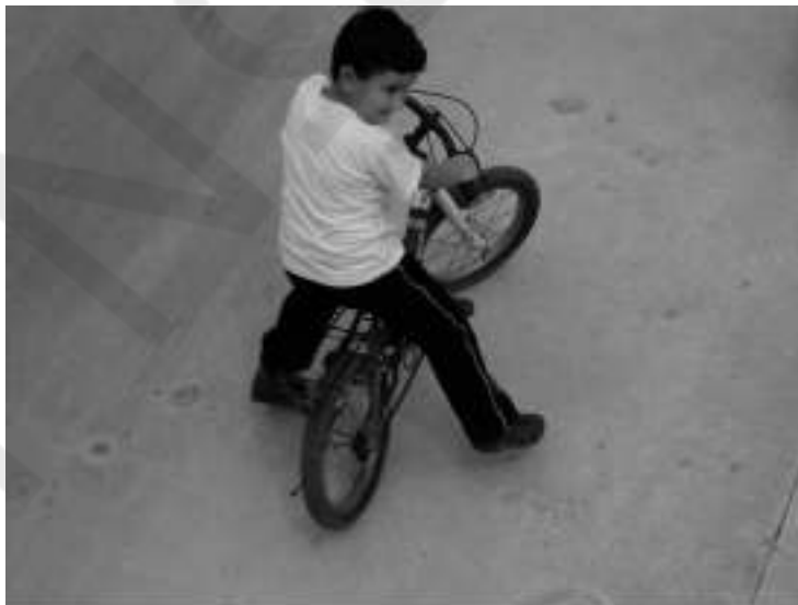
Ο «Ρόκυ» ο δεύτερος συνονόματος εγγονός του Χαμπή της Ανδριανούς

*Η ιστορία έχει στοιχεία από την πραγματικότητα που μας περιβάλλει καθώς και φανταστικά στοιχεία αλλά στηρίχθηκε σε μια ιστορία από τις τόσες του Χαμπή της Ανδριανούς. Τα παρατσούκλια Ρόκυ και Μπλόντι τα έδωσε ο παππούς Χαμπίς στα εγγόνια του, όταν τα αντίκρισε για πρώτη φορά.