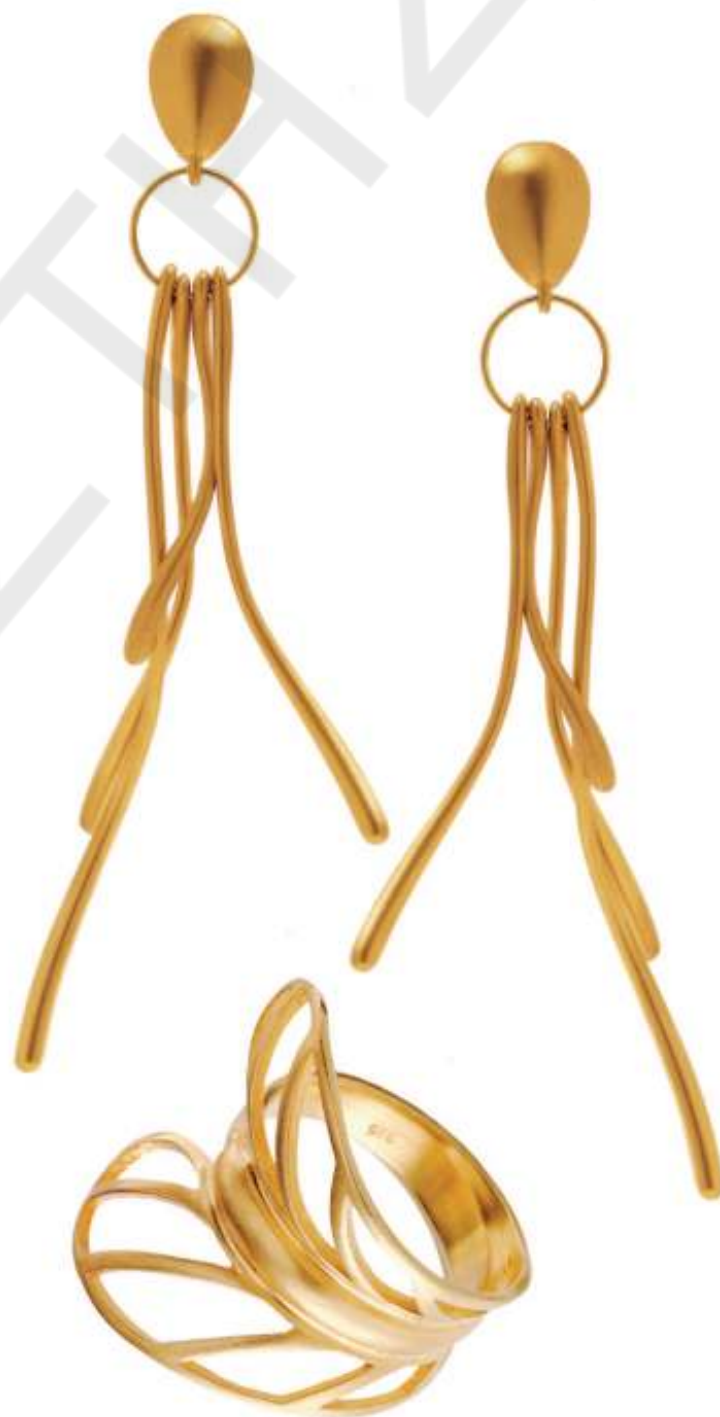
Eden Collection Κοσμήματα από 60€

Coming Soon at: Dimitrios Tsilimigras 20 Vas.Konstantinou str., Nafplio Tel.: 27520 28097 www.lilalo.gr