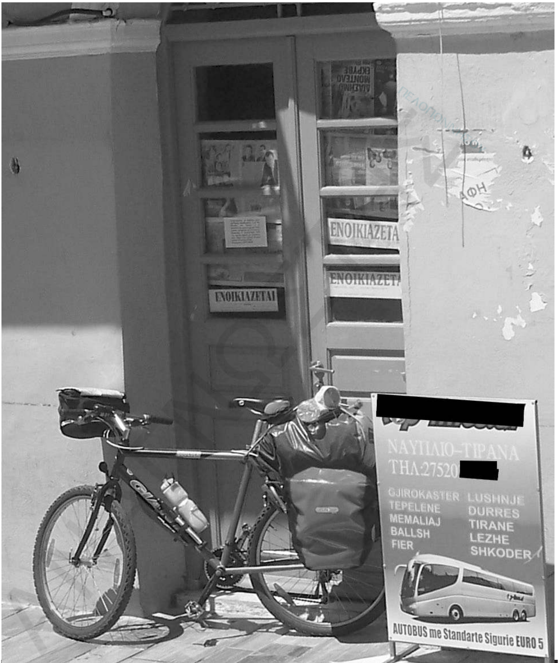
Στον αλβανικό τουρισμό εναποθέτουμε πλέον τις ελπίδες μας