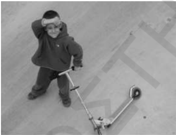
Ο Μπλόντι το πρώτο συνονόματο εγγόνι του Χαμπή της Ανδριανούς

Τα γέλια τους έφεραν ξανά την αισιοδοξία στο μπαλκόνι, το «ρεμπέτικο» καναρίνι ξανά έπιασε τα μπάσα κελαιδίσματα.