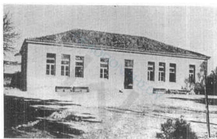
Νότια όψη του σχολείου (από το άρθρο του Μ. Μαντούδη «Les Bâtiments scolaires en Grèce», 1936, στο «L' Hellénisme Contemporain».)

την αρχή. Η εκπαιδευτική του πολιτική αντικατόπτριζε τη νέα κοινωνική δομή και το νέο πολιτικό σύστημα που επιδίωκε να εγκαθιδρύσει στην Ελλάδα. Είχε μακροπρόθεσμους σκοπούς και στόχους και εντασσόταν στο ευρύτερο κυβερνητικό πρόγραμμα. Η παροχή ίσων ευκαιριών μάθησης σε όλους ανεξαιρέτως τους πολίτες θα οδηγούσε σταδιακά στην πολιτική ωριμότητα και τη χειραφέτησή τους. Το περιεχόμενο της διδασκαλίας των μαθημάτων προσανατολιόταν προς την ελληνοχριστιανική παράδοση και δόθηκε ιδιαίτερη βαρύτητα στην εθνική διαπαι-