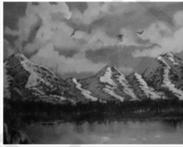
ΤΟΙΧΟΓΡΑΦΙΑ ΤΟΥ ΔΗΜΗΤΡΗ ΕΞ ΑΠΟ ΤΟ ΚΡΕΣΠΟΛΕΙΟ ΤΟΥ