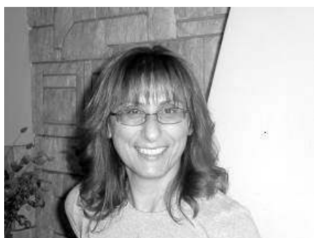
της Ελένης Δραμητινού (μέρος 'α)

Ο μικρός πρίγκιπας Antoine de saint -exupery