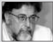
Του Γιάννη Πανούση, καθηγητή Εγκληματολογίας στο Πανεπιστήμιο Αθηνών

ΔΕΝ ΕΙΝΑΙ πολιτικά έντιμο να διατηρούμε επί 38 μεταπολιτευτικά χρόνια την Αριστερά μικρή, ισχυριζόμενοι ή αυτοβαυκαλιζόμενοι ότι μόνον έτσι θα είναι αυθεντική και «καθαρή»; Και τούτο διότι, όταν μένεις για μεγάλο χρονικό διάστημα «μικρή», δύσκολα θα παραμείνεις «άσπιλη» και διότι ο λαός ψηφίζει Αριστερά για να λυθούν τα προβλήματά του κι όχι για να παρακολουθεί εσωτερικές τάσεις, εντάσεις, διαστάσεις και διασπάσεις. Δεν είναι ζώσα η Αριστερά που παραπέμπει στο αόριστο μέλλον, στον δογματικό παράδεισο της δήθεν λαϊκής εξουσίας, την ευθύνη για το σήμερα.