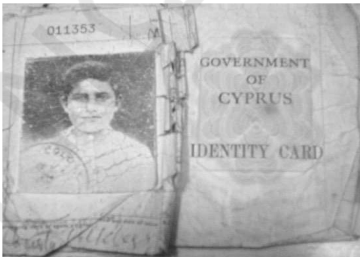
Το δελτίο ταυτότητας του Χαμπή την περίοδο της Αγγλοκρατίας