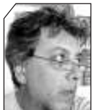
του Άκη Ντάνου

ΛΕΣ και δεν κυβέρνησαν τα δύο κόμματά τους από την μεταπολίτευση μέχρι σήμερα τον τόπο. Λες και οι πλαστές πλειοψηφίες που τους εξασφάλιζαν αυτοδυναμία δεν αρκούσαν τότε να ρυθμίσουν τα κακώς κείμενα, λες και το πελατειακό κράτος φτιάχτηκε από άλλους κι όχι απ αυτούς που κυβέρνησαν, μιλάνε τώρα για υπευθυνότητα χειρισμών!