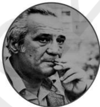
ΟΛΟΙ ΑΝΗΚΟΥΜΕ ΣΤΗΝ ΑΝΑΣΤΑΣΗ / ΘΡΙΑΜΒΟΣ ΧΡΟΝΟΥ