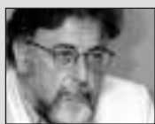
Του Γιάννη Πανούση, καθηγητή Εγκληματολογίας στο Πανεπιστήμιο Αθηνών

(ή μόνο) από τους δανειστές της (οι οποίοι συν τοις άλλοις θέλουν να την ταπεινώσουν), αλλά κυρίως από την Άτη, την Ειμαρμένη, τη Νέμεση.