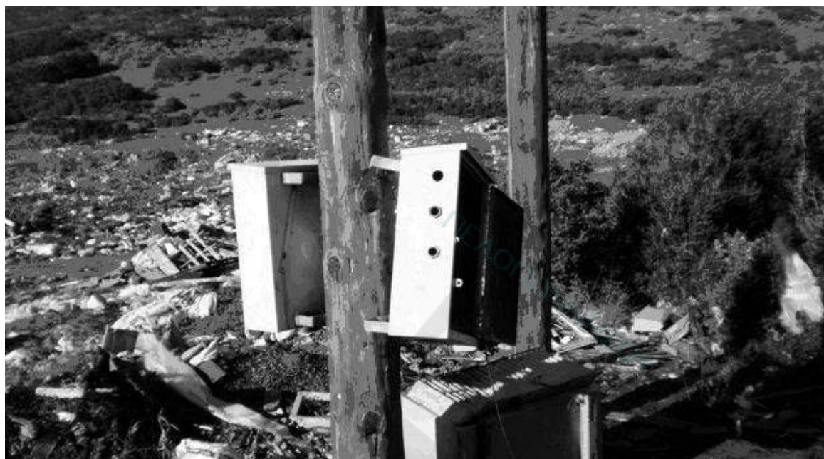
Κατηγορούνται για 27 κλοπές μετασηματιστών σε περιοχές του Άργους και του Ναυπλίου

10. Δεν είναι όλοι οι πολιτικοί ίδιοι; Ας το αποδείξουν δια της παραίτησής τους.