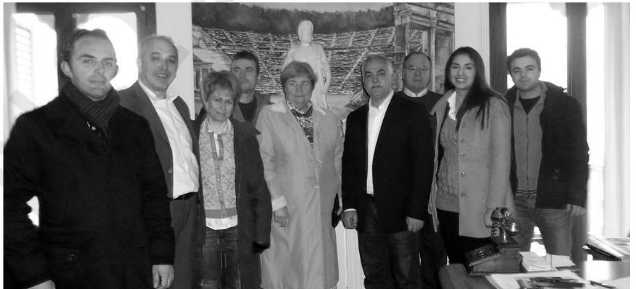
Θα έχει θέμα τη διαχρονικότητα των πολιτιστικών αξιών και το περιβάλλον