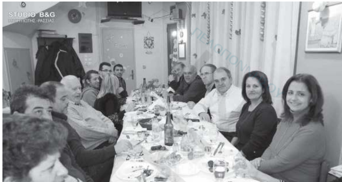
Τα μέλη του Εμπορικού Συλλόγου Ναυπλίου, με τους δημοσιογράφους

Έστω και αυτά τα λιγοστά ψώνια που θα κάνει ο καθένας μας τις ημέρες των εορτών είναι πολύ σημαντικό να γίνουν στα ντόπια καταστήματα, αφού η βιωσιμότητα των περισσότερων μικρομεσαίων επιχειρήσεων κρέμεται από μία κλωστή. Αυτό πρέπει να το καταλάβουν