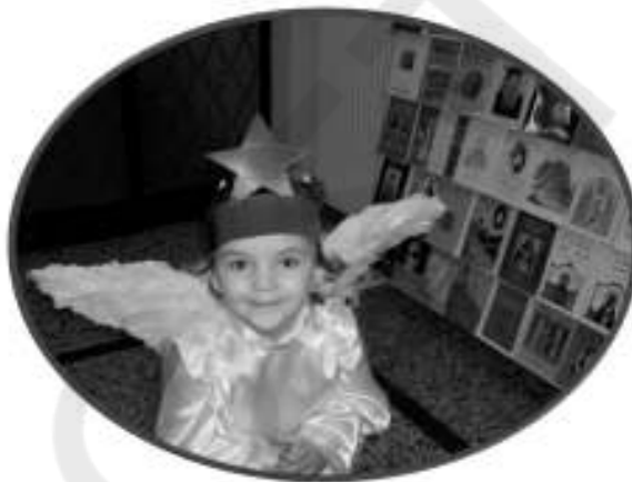
ΚΑΛΗΝ ΕΣΠΕΡΑ ΑΡΧΟΝΤΕΣ...ΔΕΝ ΜΕ ΝΟΙΑΖΕΙ Ο ΟΡΙΣΜΟΣ ΣΑΣ