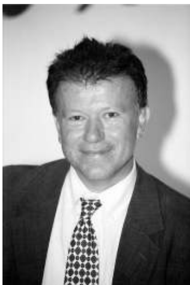
Άρθρο του Απόστολου Παπαφωτίου, Αντιπεριφερειάρχης Πελοποννήσου

Η επιβολή του Ειδικού Τέλους Ακινήτων βάσει του Ν. 4021/2011 μέσω των λογαριασμών της Δ.Ε.Η, ήλθε σε μια χρονική στιγμή ιδιαίτερα κρίσιμη για τη χώρα μας. Η όλη διαδικασία υπήρξε πρόχειρη, καθόλου μελετημένη και επιβλήθηκε άνωθεν και πολύ ξαφνικά.