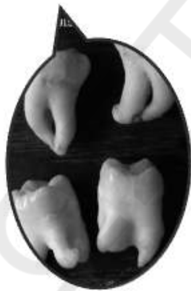
Οι ρουφιάνοι είναι περισσότεροι από τα πορτοκάλια.

*Η ιστορία έχει φανταστικά στοιχεία, αλλά πραγματικά ένα παιδί με ειδικές ανάγκες κατόπιν καταγγελίας για δήθεν κακοποίηση από τον πατέρα του βρέθηκε στο ψυχιατρείο, ο πατέρας παρά λίγο αντιμετώπισε με την δικαιοσύνη και ευτυχώς η εξαγωγή τον φρονιμίτων έσωσε την κατάσταση. Την καταγγελία είχε κάνει ένας «καλοπροαίρετος γείτονας».