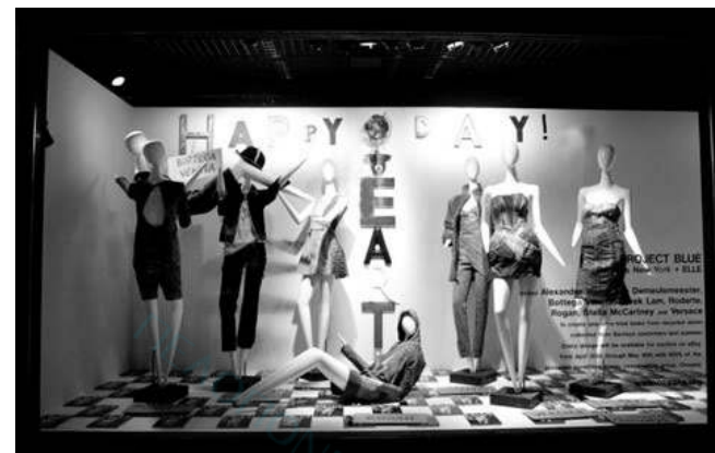
Συνεδρίασε η Ομοσπονδία Εμπορικών Συλλόγων Πελοποννήσου

Στη χώρα μας το ποσοστό των γυναικών στις οποίες ο καρκίνος ανιχνεύθηκε σε πρώιμο στάδιο στο πλαίσιο κάποιου προληπτικού ελέγχου εκτιμάται πως είναι σημαντικά μικρότερο από τα αντίστοιχα άλλων ανεπτυγμένων χωρών. Αυτό οφείλεται σε πολλούς λόγους που καθιστούν την ισότιμη πρόσβαση όλων των γυναικών σε μαστογραφικά κέντρα μία δύσκολη υπόθεση. Για να βοηθηθούν οι γυναίκες στην ελληνική ύπαιθρο που λόγω γεωγραφικών ιδιαιτεροτήτων, κοινωνικών δυσκολιών ή προκαταλήψεων και οικονομικών προβλημάτων, δεν έχουν πρόσβαση ή αδυνατούν να υποβληθούν σε μαστογραφικό έλεγχο, η Ελληνική Αντικαρκινική Εταιρεία μετά από μία γενναία χορηγία και συνεχή υποστήριξη της εταιρείας καλλυντικών AVON κατασκεύασε και εξόπλισε με σύγχρονα μηχανήματα μία κινητή μονάδα μαστογράφου. Η μονάδα αυτή περιοδεύει σε διάφορες περιοχές της χώρας μας και προσφέρει δωρεάν μαστογραφικό έλεγχο στις γυναίκες που το έχουν ανάγκη.