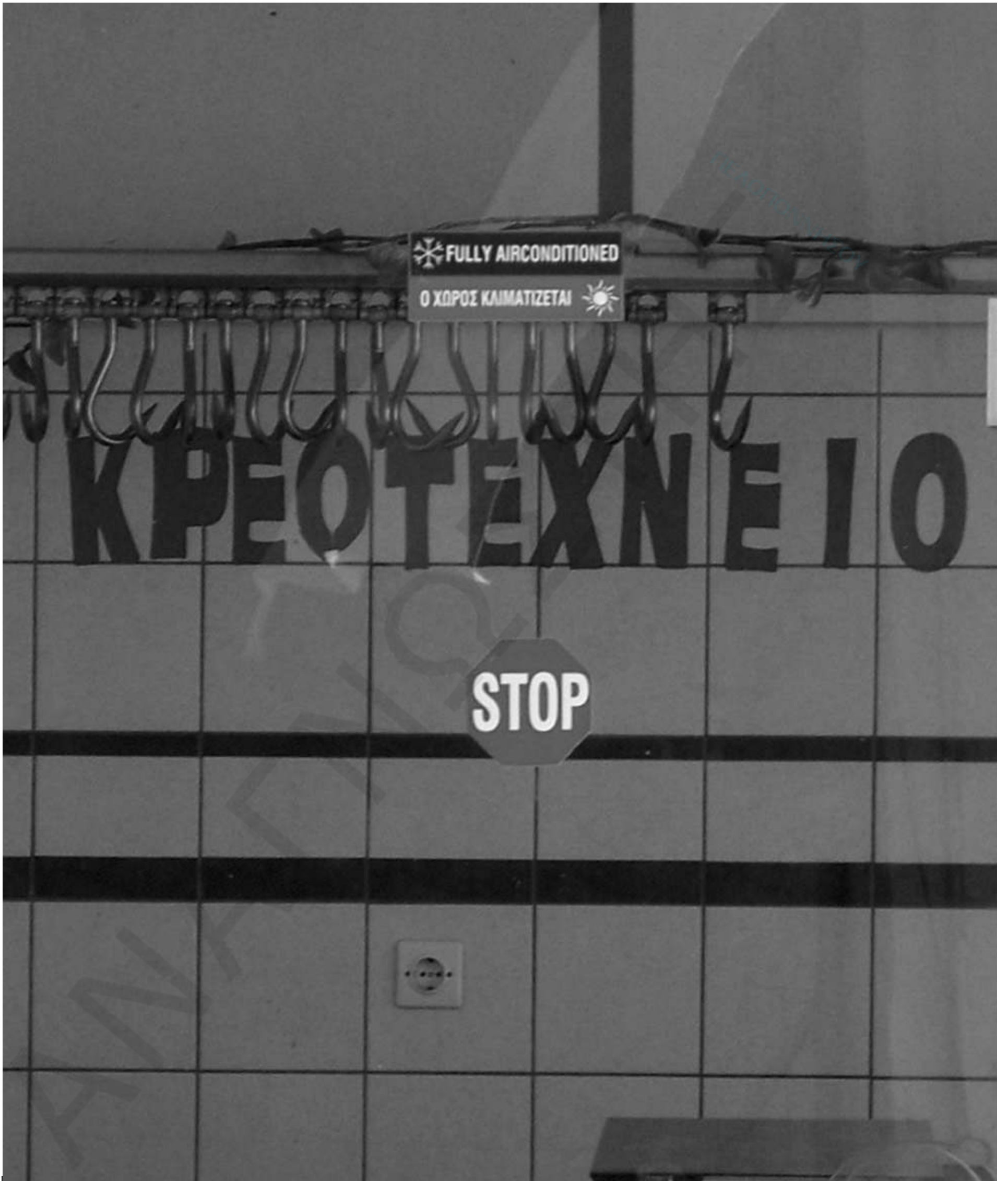
Κρεοτεχνείο φορολογουμένων η «Ωραία ΔΟΥ»