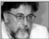
Του Γιάννη Πανούση, καθηγητή Εγκληματολογίας στο Πανεπιστήμιο Αθηνών

Η δοξολόγηση, η κρίση και το τέλος του Καπιταλισμού άλλοτε εμφανίζονται ως εσχατολογική θρησκεία κι άλλοτε ως (κεκαλυμμένη;) business. Απαντες (πλην των αφελών ιδεολόγων) «κερδοσκοπούν» με τον φόβο.