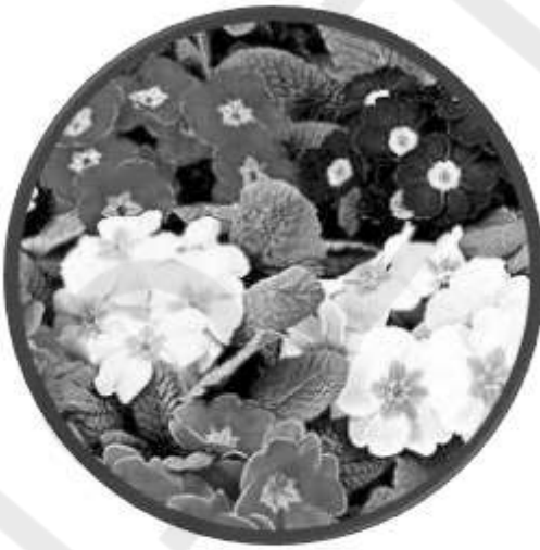
ΚΟΙΤΑ ΤΙ ΩΡΑΙΑ ΠΑΝΣΕΔΑΚΙΑ !!!!