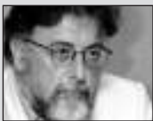
Του Γιάννη Πανούση , καθηγητή Εγκληματολογίας στο Πανεπιστήμιο Αθηνών