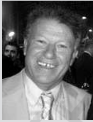
Του Απόστολου Παπαφωτίου, Αντιπεριφερειάρχη Πελοποννήσου

Πολύ συχνά, από τον Περιφερειάρχη Πελοποννήσου κ. Πέτρο Τατούλη αναφέρεται ότι ο «Καλλικράτης» είναι η μεγαλύτερη Διοικητική μεταρρύθμιση από της συστάσεως του ελληνικού κράτους και αποτελεί, ενδεχομένως, την τελευταία ευκαιρία για την Ελλάδα. Και τούτο, καθόσον, η σωστή υλοποίηση του «Καλλικράτη» θα οδηγήσει τις περιφέρειες σε οργανωτικές πολιτικοοικονομικές και ανθρωπογεωγραφικές οντότητες, με ταυτότητα τόπου και εδαφικού κεφαλαίου και