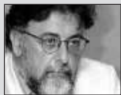
Του Γιάννη Πανούση, καθηγητή Εγκληματολογί- ας στο Πανεπι- στήμιο Αθηνών

Έχουν κουραστεί. Έχουν κο- ρεστεί, Έχουν διαπλακεί. Έχουν φο- βηθεί.