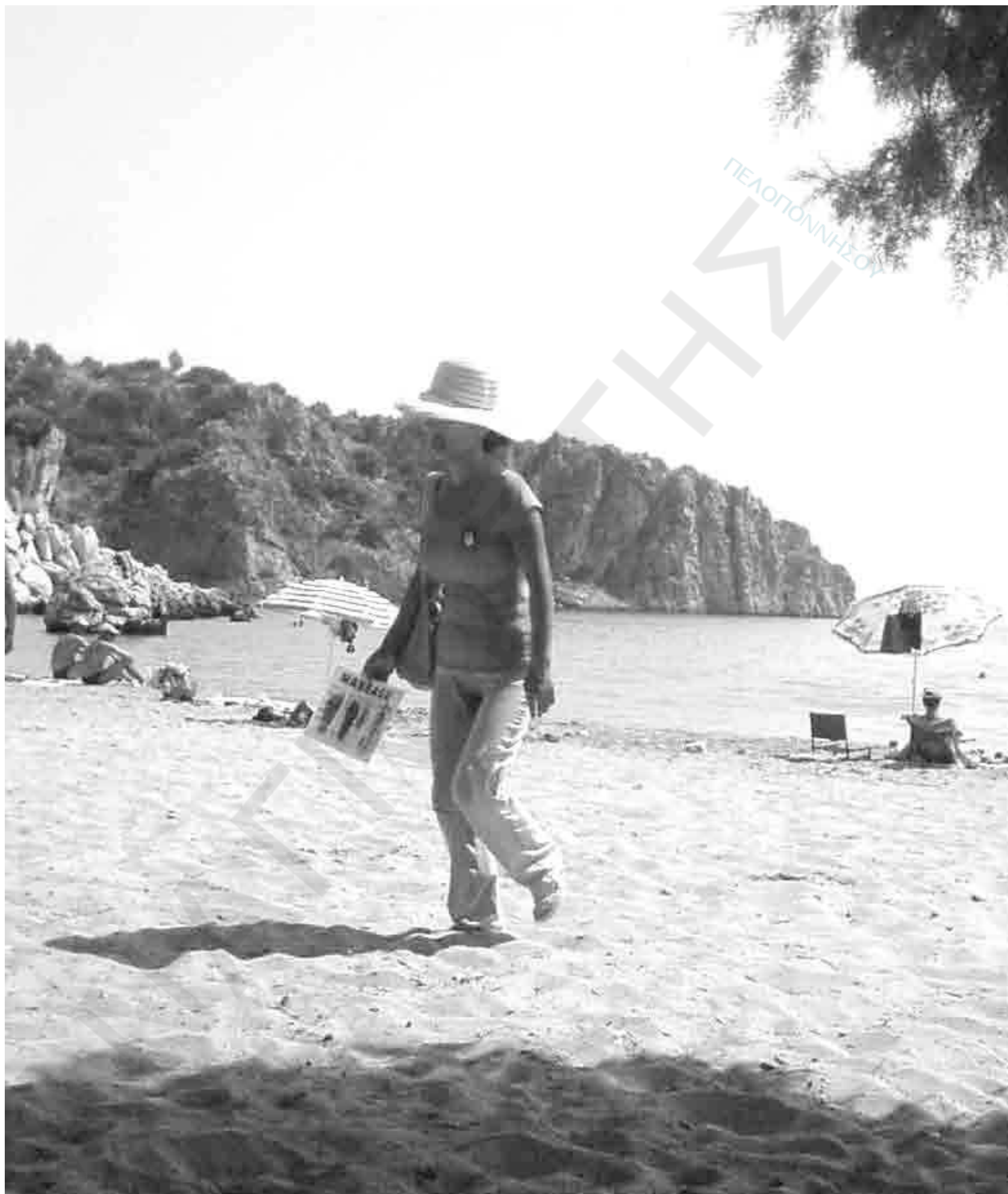
Κινέζικο μασάζ στην παραλία: Και αυτό το χτύπησε η κρίση.