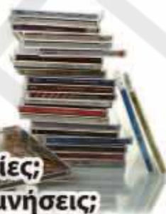
photo BOOK economy

Στιβαγμένα cd; Σκονισμένες φωτογραφίες; Αμέτρητες χαμένες αναμνήσεις;