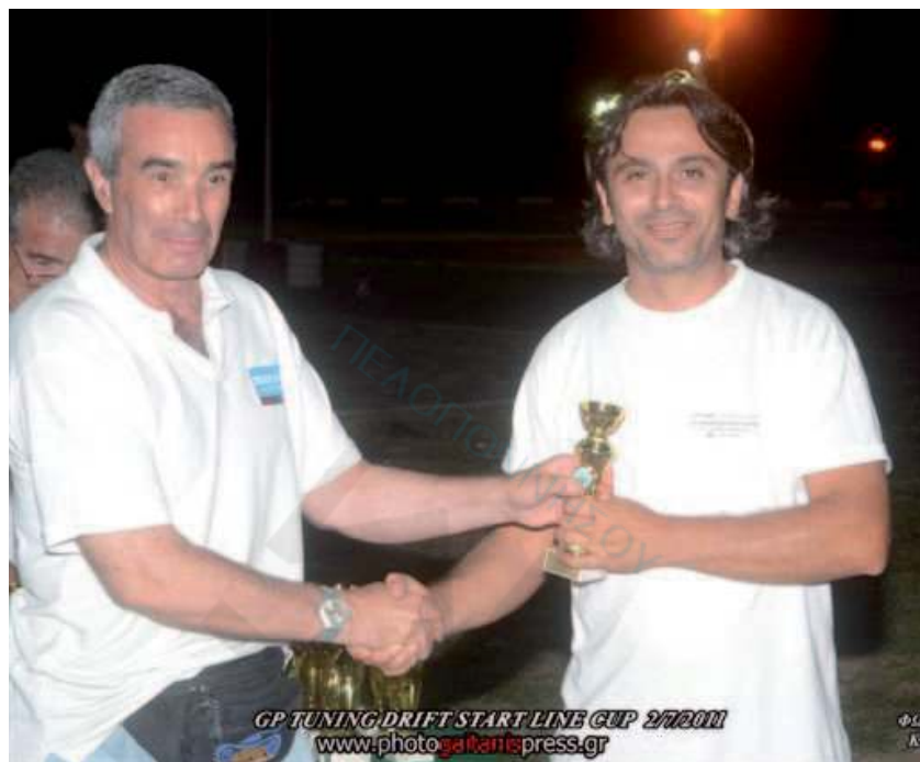
GP TUNING DRIFT START LINE CUP 2/7/2011 www.photo.galaktispress.gr