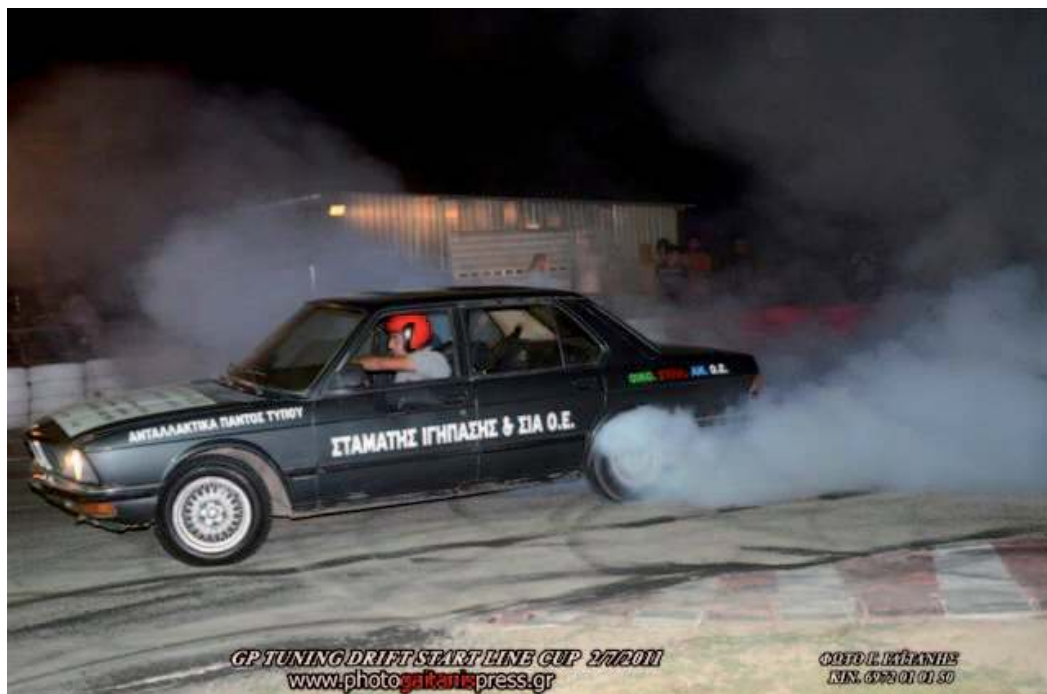
GP TUNING DRIFT START LINE CUP 2/7/2011