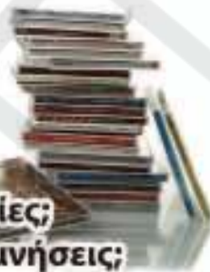
photo BOOK economy

Στιβαγμένα cd; Σκονισμένες φωτογραφίες; Αμέτρητες χαμένες αναμνήσεις;