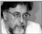
Του Γιάννη Πανούση, καθηγητή Εγκληματολογίας στο Πανεπιστήμιο Αθηνών

ΥΓ.2 Πρώτα Δημοκρατία και μετά σοσιαλισμός. Αλλιώς όλα θα είναι βαρβαρότητα.