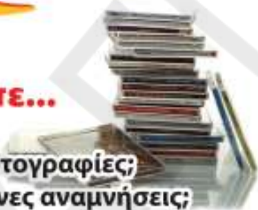
photo BOOK economy

Στιβαγμένα cd; Σκονισμένες φωτογραφίες; Αμέτρητες χαμένες αναμνήσεις;