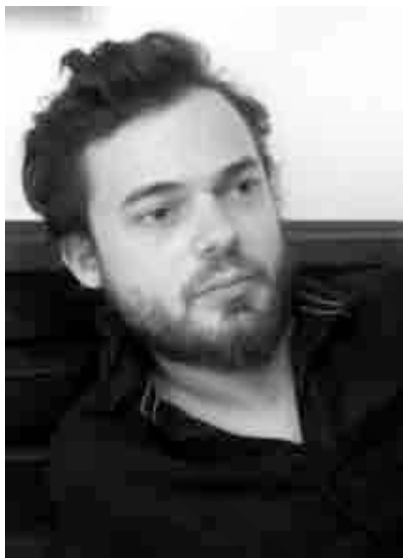
Γράφει ο συγγραφέας Θοδωρής Καραγεωργίου

Η ιστορία του γάτου που έμαθε σ' ένα γλάρο να πετάει Λουίς Σεπούλβεδα Μετ. Αχιλλέας Κυριακίδης Εκδόσεις: Opera Έτος: 2007 Σελ. 154 Τιμή: 11,60 €