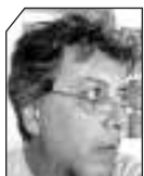
του Άκη Ντάνου

ΣΥΝΗΘΩΣ όταν στην Ελλάδα αναφερόμαστε στον κοινωνικό ιστό, τον περιορίζουμε στις κοινωνικές παροχές του κράτους το οποίο το τοποθετούμε και ως εγγυητή