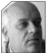
του Ακη Γκάτζιου

ΠΟΙΟΣ ΑΠΟ τους υποψήφιους δημάρχους που ξεφυτρώνουν καθημερινά σαν τα μανιτάρια θα μιλήσει τελικά στους δημότες για τα άδεια ταμεία των δήμων; Η ΟΙΚΟΝΟΜΙΚΗ ΚΡΙΣΗ αρχίζει πλέον με ταχύτατους ρυθμούς να αγγίζει τους ΟΤΑ. Πρώτο παράδειγμα που δημοσιοποιήθηκε έστω κεκαλυμμένα με την συσκευασία άλλων έργων που πράγματι γίνονται, ήταν το Ναύπλιο με το «κόψιμο» ενός εκατομμυρίου ευρώ για έργα που είχαν εξαγγελθεί και επρόκειτο να δημοπρατηθούν τις επόμενες μέρες.