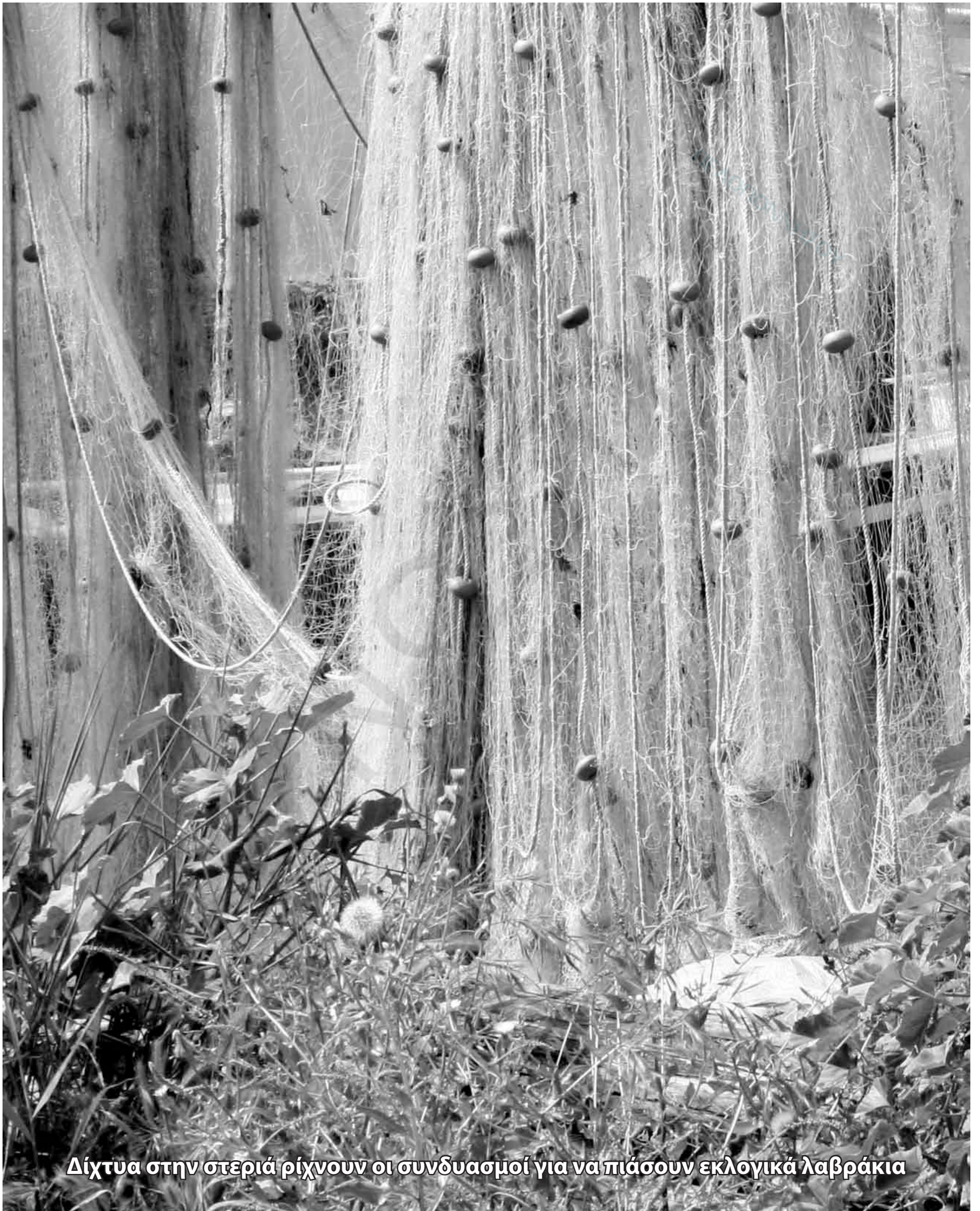
Δίκτυα στην στεριά ρίχνουν οι συνδυασμοί για να πιάσουν εκλογικά λαβράκια