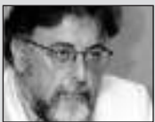
Του Γιάννη Πανούση, καθηγητή Εγκληματολογίας στο Πανεπιστήμιο Αθηνών

Μολονότι η παγκοσμιοποίηση φαίνεται να εισάγει ένα νέο «ουδέτερο» διαχειριστικό στιλ στην αντιμετώπιση των προβλημάτων, συνδέεται με «τη συσσωμάτευση σε μια ενιαία τάξη πραγμάτων όχι μόνο των εθνικών οικονομιών, αλλά και των θεσμικών πρακτικών». Η εθνική κυριαρχία και η πολιτιστική ιδιαιτερότητα δεν συνιστούν πλέον ικανά επιχειρήματα για «αποκλίσεις» από διεθνή standards.