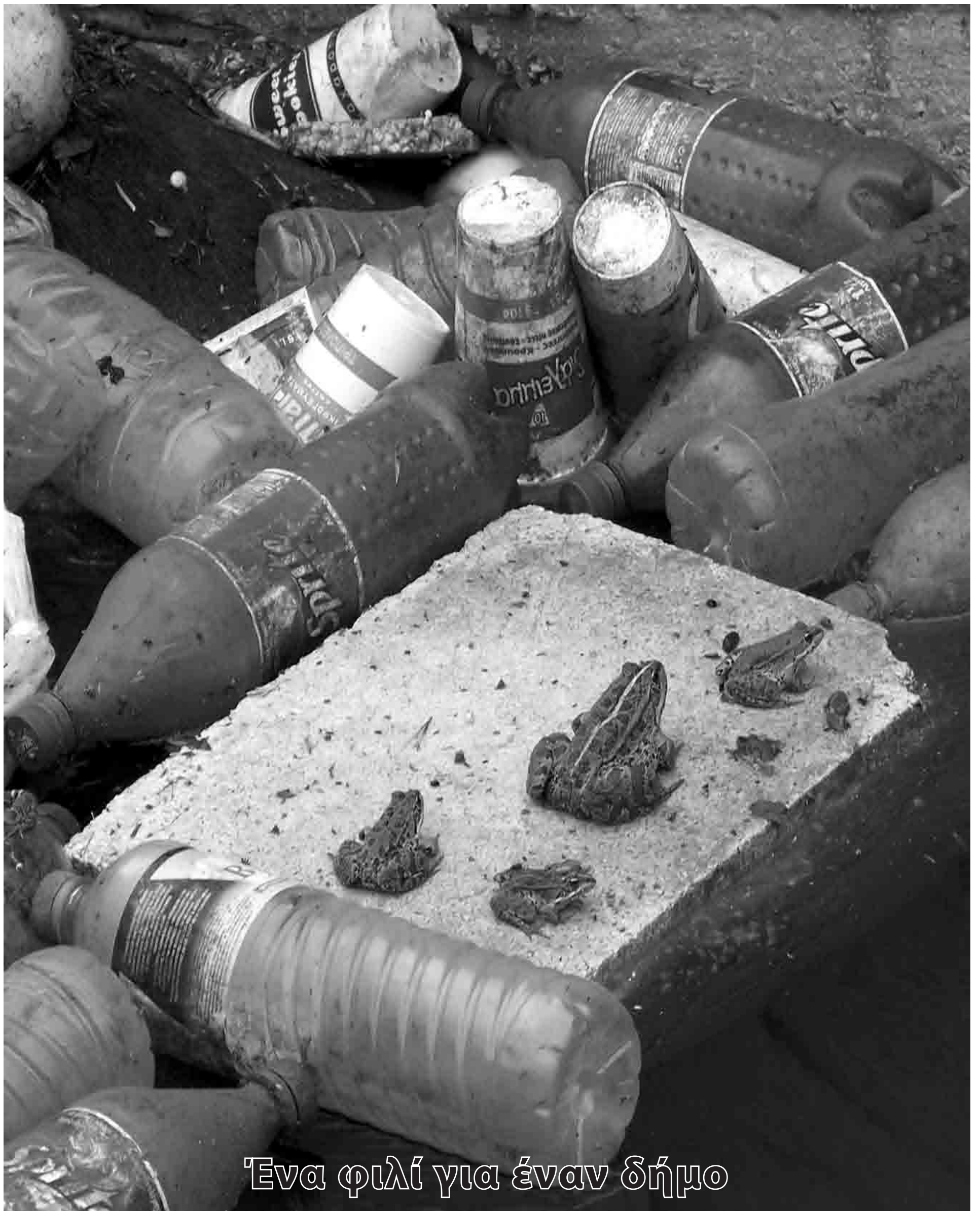
Ένα φιλί για έναν δήμο