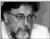
Του Γιάννη Πανούση, καθηγητή Εγκληματολογίας στο Πανεπιστήμιο Αθηνών

Η ΔΙΚΑΙΟΣΥΝΗ συμβαδίζει με τη θεωρία του κοινωνικού συμβολαίου, προϋποθέτει δηλαδή μια «πρωταρχική συμφωνία» (έστω υποθετική).