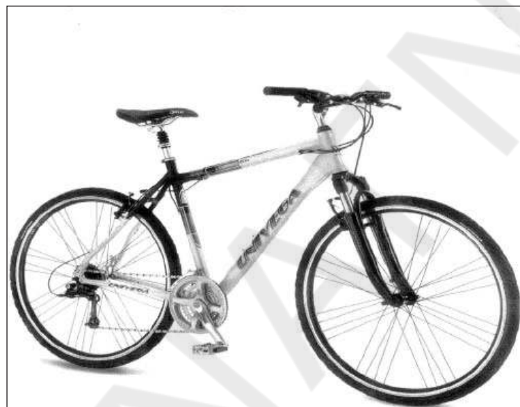
ΠΟΔΗΛΑΤΟ TREKKING UNIVEGA ΧΡΩΜΑΤΟΣ ΓΚΡΙ