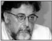
Του Γιάννη Πανούση, καθηγητή Εγκληματολογίας στο Πανεπιστήμιο Αθηνών

Θύμα της οικονομικής κρίσης κρατική υπηρεσία στο Ναύπλιο