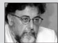
Του Γιάννη Πανοδή, καθηγητή Εγκληματολογίας στο Πανεπιστήμιο Αθηνών

ΚΑΤ'ΑΡΧΗΝ οι ηθικοπολιτικές αξιολογήσεις δεν αποφεύγουν τις «παράπλευρες» απώλειες. Το έγκλημα ως παραβίαση ποινικού νόμου, ως παράβαση και απόκλιση από κανόνα και κανονικότητα, ως κοινωνική κατασκευή, ως ιδεολογική και πολιτική