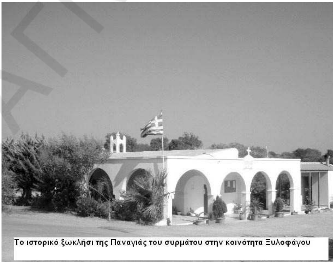
Το ιστορικό ξωκλήσι της Παναγίας του συρμάτου στην κοινότητα Ξυλοφάγου

πράγματα που μας βάζουν σε ένταση και έντονο στρες αλλά αν προσέξουμε γιατί ο πανικός είναι κακός σύμβουλος και όχι μόνο στον προορισμό μας δεν θα φθάσουμε αλλά θα χάσουμε και πολύτιμο χρόνο. Όσο για το φορτηγό που κουβαλάει όλα τα αγαθά της καθημερινότητας μας έχουμε και εμείς ευθύνη για αυτόν που διαλέγουμε να μας καθοδηγήσει στους ελιγμούς του. Και τους πολιτικούς στο καμπαρέ της εξουσίας μπορεί να τους αιφνιδιάσουμε αν αντί για το εύκολο ροζ δωμάτιο που θα μας προτείνουν τους πούμε ότι απόψε εν ( δεν ) νυστάζουμε και θα αγρυπνήσουμε για ένα καλύτερο αύριο.