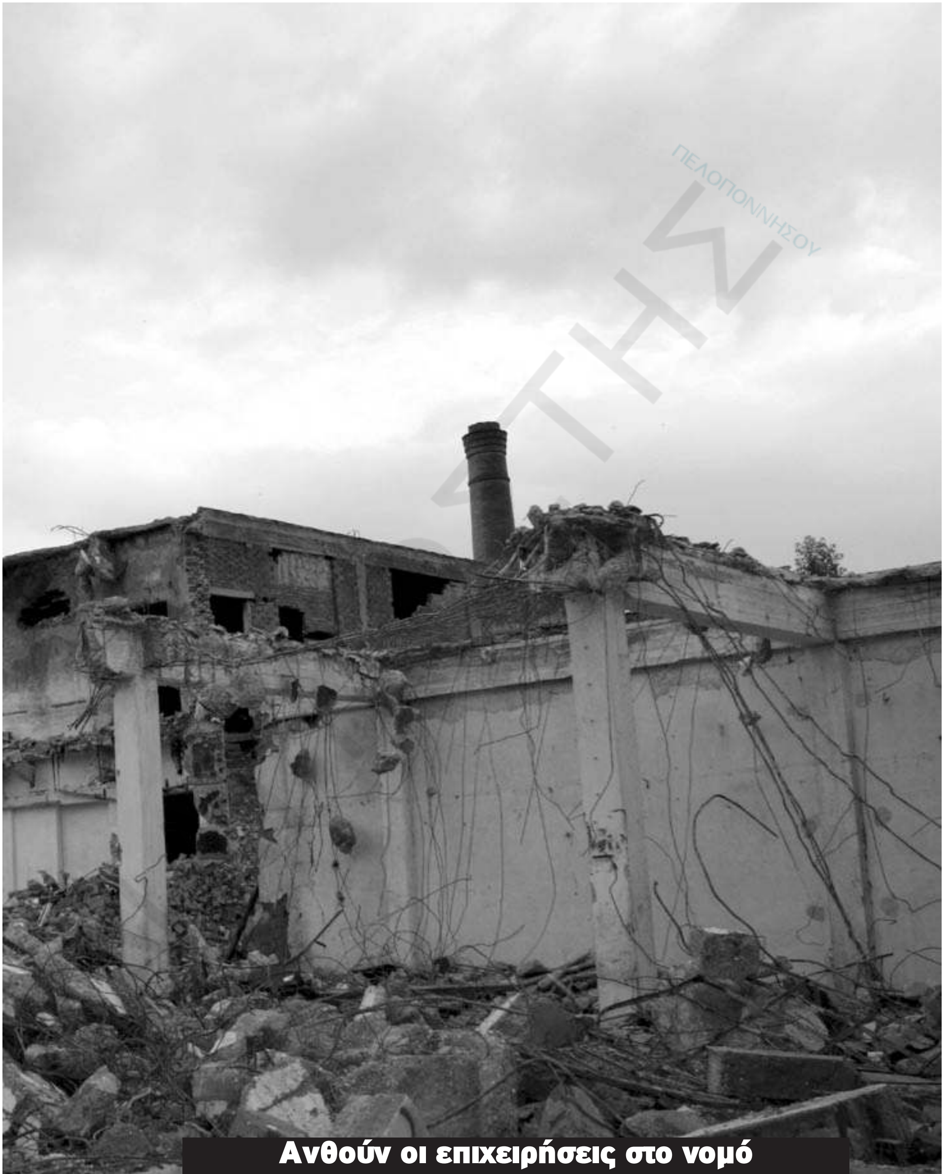
Ανθούν οι επιχειρήσεις στο νομό