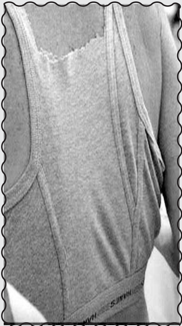
Μετά την πατέντα της μάσκας - Στριγκ της περασμένης εβδομάδας, σας παρουσιάζουμε την πατέντα για το μπλουζάκι-αντρικό σώβρακο.