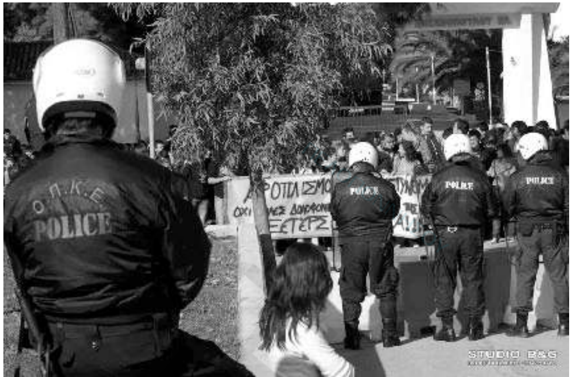
Διαμαρτυρίες στην μνήμη του Αλέξη Γρηγορόπουλου σε Ναύπλιο, Άργος και Κρανίδι

ΥΓ.: Παρακαλώ όσους δημοσιογράφους έγκριτων κυριακάτικων εφημερίδων χρησιμοποιούν το όνομά μου να διασταυρώνουν προηγουμένως τις πληροφορίες τους ή ν' αποφεύγουν τις προβοκάιες.