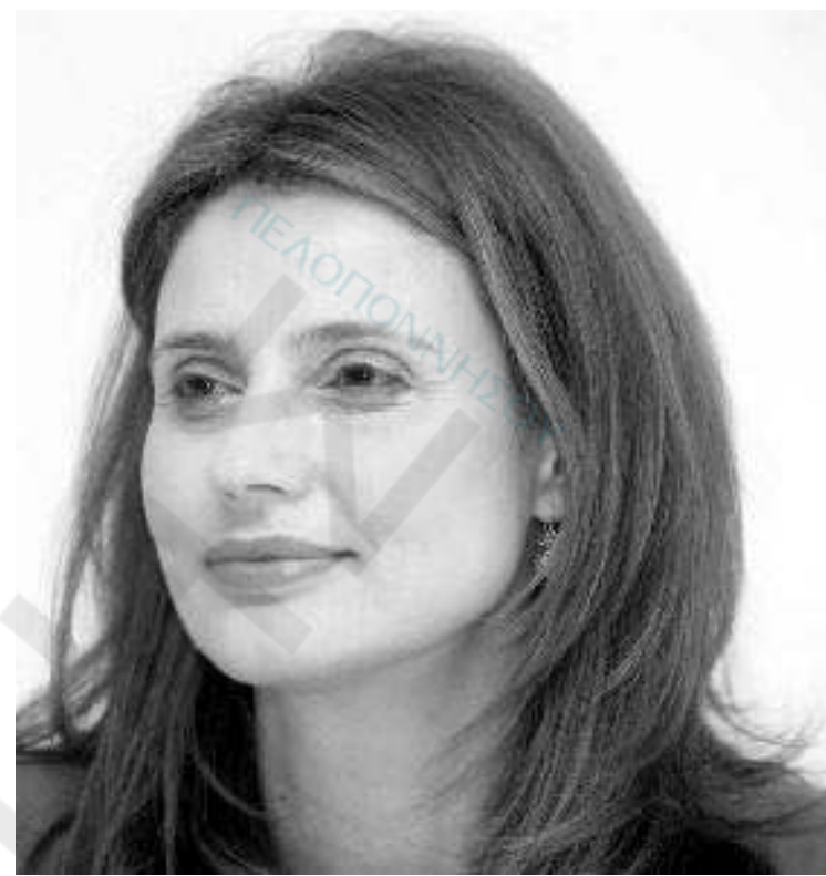
Χώρας υπουργικής απόφασης, την αναγκαιότητα να ισχύσει ο προκειμένου να το θέσει υπ' όψη της κα Υπουργού, αναδεικνύοντας την αναγκαιότητα να ισχύσει ο προκηρυχθείς διαγωνισμός, όπως είχε αρχικά προγραμματιστεί».

Για όλους τους παραπάνω λόγους παρακαλούμε να συζητηθεί στο Δ.Σ. της ΚΕΔΚΕ το αίτημά μας για απόσυρση της επαχθούς για τους ΟΤΑ των περιοχών ΟΠΠΑΧ της