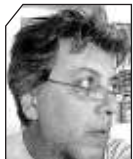
του Άκη Ντάνου

ΕΝΑΣ ΤΕΡΑΣΤΙΟΣ λάκκος που άνοιξε προ καιρού η ΔΕΥΑΑΡ, σύμφωνα με δημοτικό σύμβουλο με τον οποίο επικοινωνήσαμε