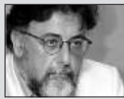
Του Γιάννη Πανοδόση, καθηγητή Εγκληματολογίας στο Πανεπιστήμιο Αθηνών

ΑΥΤΕΣ οι διακομματικού χαρακτήρα «έσω/έξω εξουσίες», πέραν των αλλοιώσεων που επιφέρουν στο πολιτικό σύστημα, προκαλούν και συγχύσεις στην κοινωνία, δημιουργώντας μύθους ή θέτοντας ψευδοδιλήμματα.