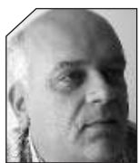
του Ακη Γκάτζιου

«ΚΑΛΥΤΕΡΑ ΠΑΠΑΚΙ, παρά τον Μητσοτάκη» φώναζαν όμως οι αντίπαλοι της Νέας Δημοκρατίας και ο τότε πρωθυπουργός κατέληξε να φέρει απλά τον τίτλο του επίτιμου, χάνοντας την εξουσία. Κάτι ανάλογο προδιαγράφεται και για τον Καραμανλή.