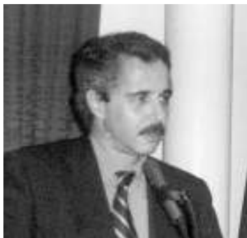
Άρθρο Γ. Μανιάτη, βουλευτή ΠΑΣΟΚ Αργολίδας

Είναι βέβαιο ότι στο μέσο της παγκόσμιας πολύπλευρης οικονομικής, περιβαλλοντικής και ενεργειακής κρίσης που ζούμε, ο τουρισμός, όπως και όλοι σχεδόν οι οικονομικοί τομείς, διέρχονται σοβαρή κρίση. Η κρίση αυτή δεν σχετίζεται μόνο με τη μείωση του διαθέσιμου εισοδήματος για διακοπές και μετακινήσεις μεγάλου μέρους των μεσαίων στρωμάτων των χωρών προέλευσης τουριστών στην Ελλάδα. Σχετίζεται, επιπλέον, με το αδιέξοδο στο οποίο ουσιαστικά είχε περιέλθει ο ελληνικός τουρισμός, πριν το ξέσπασμα της κρίσης. Ουσιαστικά στη χώρα μας είχαμε μία κρίση, πριν την κρίση. Όλοι γνωρίζαμε ότι το τουριστικό μας προϊόν ήταν γηρασμένο, λιγότερο ανταγωνιστικό σε σχέση με το παρελθόν, αφού είναι ένα προϊόν το οποίο μπορούν φθηνότερα και με καλύτερη ποιότητα υπηρεσιών να προσφέρουν άλλες ανταγωνίστριες χώρες, τόσο στη μεσόγειο όσο και σε άλλα σημεία του πλανήτη. Σημαντικός συντελεστής αυτής της κρίσης ήταν η ανυπαρξία οποιασδήποτε ολοκληρωμένης χωροταξικής, πολεοδομικής και περιβαλλοντικής προσέγγισης των διαφόρων περιοχών της χώρας. Έλλειψη περιφερειακής ισορροπίας, υπερσυγκέντρωση κλινών σε λίγες περιοχές, βαθιές πληγές στο φυσικό και ανθρωπογενές περιβάλλον, ανυπαρξία ισχυ-