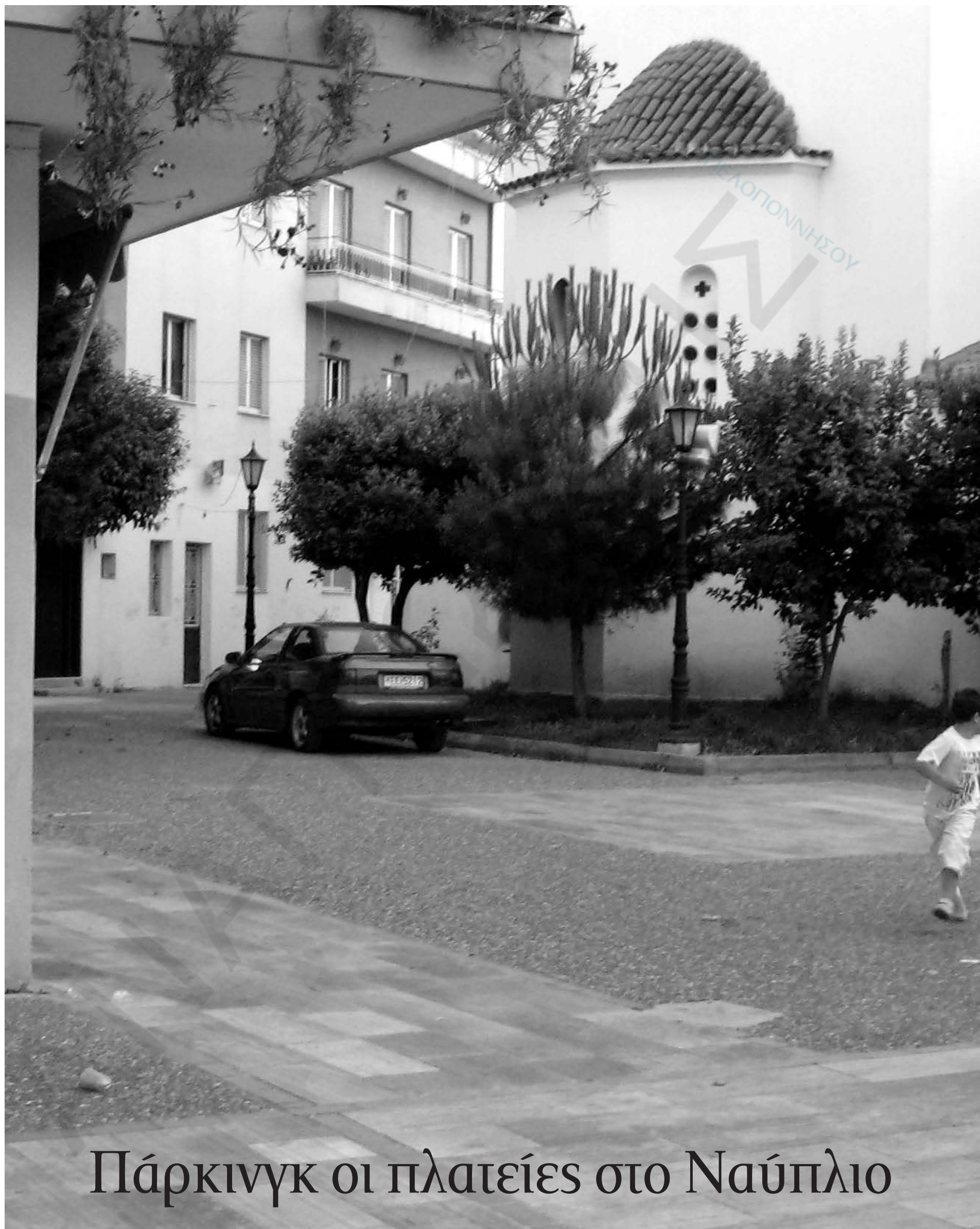
Πάρκινγκ οι πλατείες στο Ναύπλιο