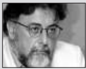
Του Γιάννη Πανούση, καθηγητή Εγκληματολογίας στο Πανεπιστήμιο Αθηνών

Στο πλαίσιο του κολοβού διαλόγου για την εκπαίδευση θα έπρεπε να ενταχθεί και ο προβληματισμός για τον ρόλο του δασκάλου (της πρωτοβάθμιας, δευτεροβάθμιας ή και τριτοβάθμιας κλίμακας). Κι αυτό διότι ως γνωστόν τα συστήματα δεν λειτουργούν από μόνα τους, αλλά προϋποθέτουν την ενεργό συμμετοχή/διαμεσολάβηση/θετική δράση του χειριστή-δασκάλου.