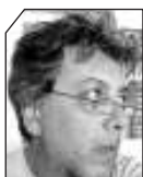
του Ακχ Ντάνου

ΓΙΑ ΕΛΛΕΙΨΗ ανταγωνιστικότητας των τουριστικών επιχειρήσεων δεν μιλά κανείς, παρά μόνο εκείνοι που προωθούν