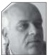
του Ακί Γκάτζιου

ΟΛΑ ΞΕΚΙΝΗΣΑΝ, όταν ο πάλαι ποτέ Θεόδωρος Ρουσοόπουλος έφερε στη Βουλή προς ψήφιση τον νέο τυποκτόνο νόμο τον Μάρτιο του 2007,