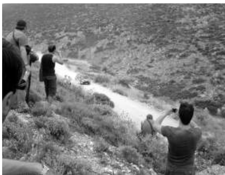
Τα φλας άστραφταν μόλις περνούσαν τα αγωνιστικά αυτοκίνητα