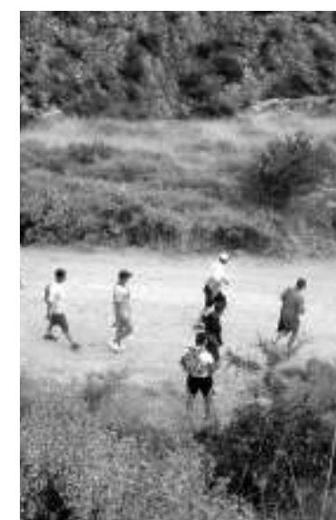
Πολύ περπάτημα στην ανηφόρα για τους θεατές, αλλά και η επιστροφή ήταν δύσκολη