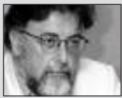
Του Γιάννη Πανοδόση, καθηγητή Εγκληματολογίας στο Πανεπιστήμιο Αθηνών

Μέσα στο κλίμα των τακτικισμών και των εξυπνακίστικων τρικ των κομμάτων ενόψει εκλογών εντάσσονται και τα διάφορα συνθήματα. Μολονότι οι όποιες κινήσεις αρχηγών και αρχηγίσκων συνιστούν ασκήσεις αυταρέσκιας/ αυτοδικαίωσης και ουδέν το πολιτικόν προσφέρουν, έχει νομίζω ενδιαφέρον να αναλύσουμε το εγχείρημα του πολιτικού συστήματος να παρουσιαστεί ως εντολοδόχος ή πληρεξούσιος των ψηφοφόρων. Δεν γνωρίζω αν αυτή η πρακτική υποκρύπτει την πραγματική ανάγκη των πολιτευόμενων να αφογκραστούν τον παλμό του κόσμου