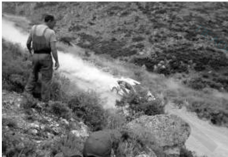
Πλούσιο θέαμα πρόσφεραν οι αγωνιζόμενοι στα ...σπαστήρια της Αργολίδας