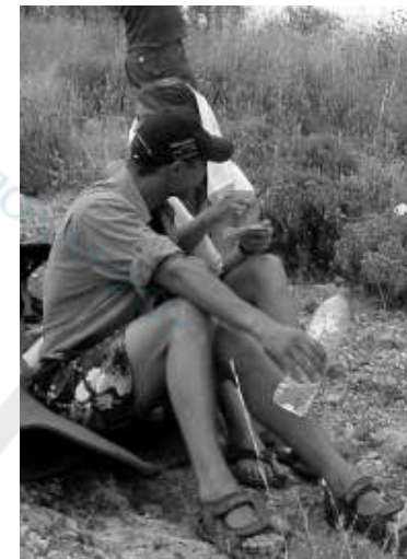
Ακόμα και τουρίστες, πήγαν να δουν το διεθνές ράλι.

Πλούσιο θέαμα και πολύ σκόνη με τρελές ταχύτητες στους χωματόδρομους της Αργολίδας, πρόσφερε το ράλι Ακρόπολις στους πολλούς θεατές που έσπευσαν να το απολαύσουν.