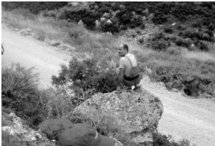
Οι θεατές από νωρίς φρόντισαν να πιάσουν καλές θέσεις με ορατότητα