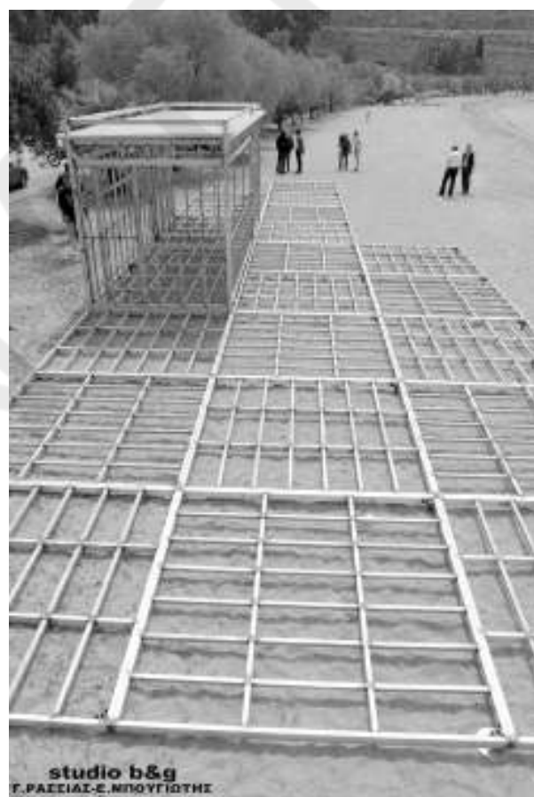
studio b&g F.ΡΑΞΙΑΣ-Ε.ΝΠΟΥΓΙΣΤΗΣ

Οι αντιδράσεις των κατοίκων και φορέων, αλλά και οι αμφισβητούμενες νομιμότητας όροι της σύμβασης εκμίσθωσης της Καραθώνας, δεν επέτρεψαν μέχρι σήμερα την εγκατάσταση του ιδιώτη».