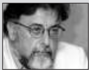
Του Γιάννη Πανοδού, καθηγητή Εγκληματολογίας στο Πανεπιστήμιο Αθηνών

Οι αντικοινωνικές πράξεις είναι το τελικό αποτέλεσμα (και ενός ελαττωματικού κοινωνικού χώρου, καθώς νοσηρός περίγυρος και νοσηρή συμπεριφορά συχνά συνδέονται άρρηκτα. Το δικαίωμα στην ασφαλή πόλη συνδέεται με την οικολογία