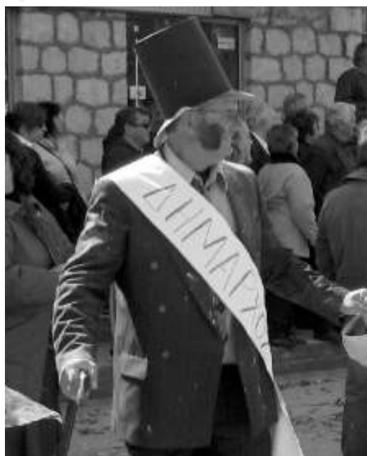
Η δημοτική αρχή προσφιλές θέμα στο Λυγουριό