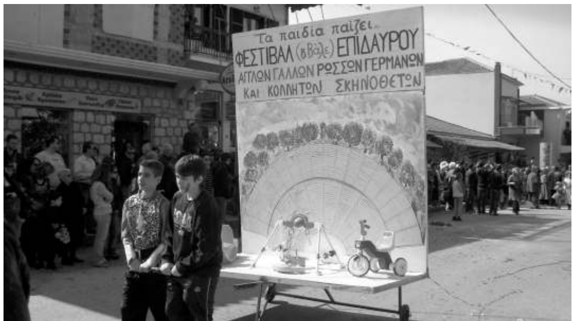
Το Φεστιβάλ Επιδαύρου δεν πέρασε απαρατήρητο

του Λυγουριού ήρθαν οπλισμένοι με αυτοπεποίθηση, εμπειρία, πολύ κέφι και όρεξη για ατέλειωτα γλέντια. Η θεματολογία είχε μεγάλη ποικιλία από τα περισσότερα επίκαιρα θέματα, όπως η οικονομία, περνώνας μέσω της αποκριάς μηνύματα διαμαρτυρίας, όπως το άρμα που έγραφε: «Το Ναυάγιο: Η απληστία των ισχυρών και η μαλακία των φτωχών βούλιαξαν το καράβι των οικονομικών». Την Καθαροδευτέρα στο Λυγουριό έγινε ένα τρελό αποκριάτικο ξεφάντωμα. Μεταξύ του χορού και των τοπικών ακουσμάτων τα τοπικά θέματα άρεσαν ιδιαίτερα, όπως το άρμα για το λάδι: «Το λάδι: το τρώνε τα μικρά παιδιά, το τρών' και οι μεγάλοι, τον τρώ-