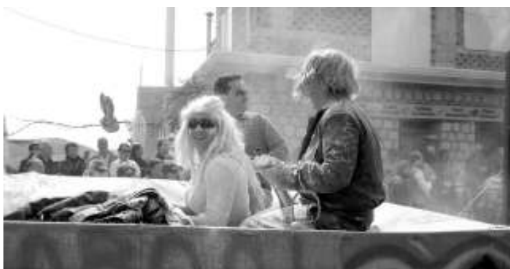
Στάχτη, μπουτzuρά και μπινελίκι