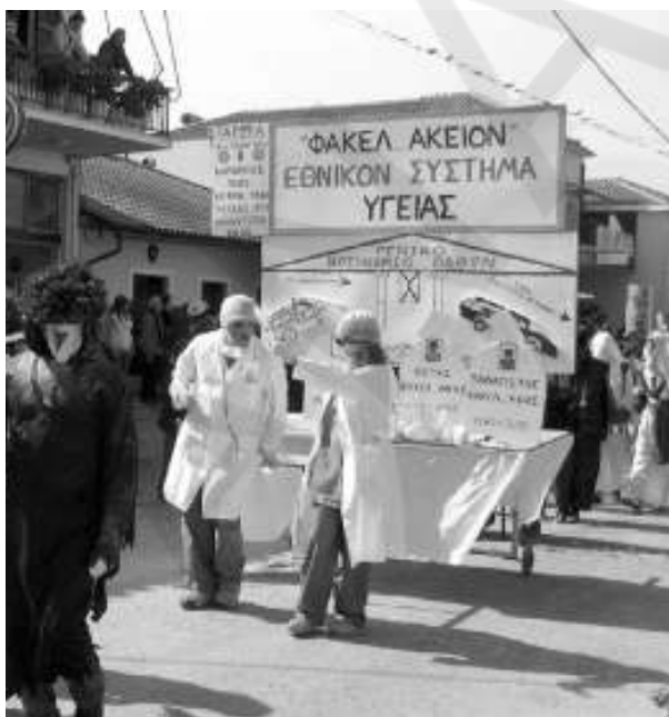
Η Υγεία είχε τον πρώτο λόγο στα άρματα