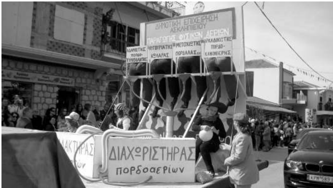
Σατίρισαν ακόμα και τον εαυτό τους οι διοργανωτές