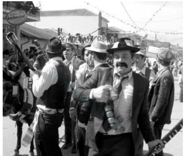
Μεγάλη η συμμετοχή μικρών και μεγάλων