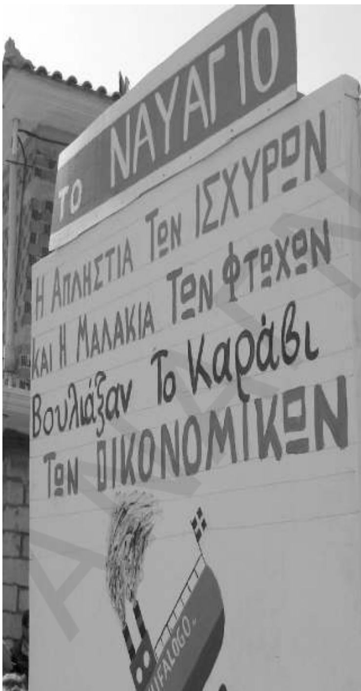
Πέρασαν μέσω της αποκριάς μηνύματα διαμαρτυρίας

Με μικρό κόστος σε σχέση με το Ναύπλιο και πολύ κέφι από τους συμμετέχοντες το Λυγουριάτικο Καρναβάλι είχε μεγάλη επιτυχία την Καθαρή Δευτέρα. Δεν έλειψαν βέβαια και τα παρατάγουντα, όπως η μεγάλη καθυστέρηση έναρξης ή η διέλευση αυτοκινήτων από τον δρόμο μέχρι λίγα λεπτά πριν περάσουν τα άρματα, όμως όλα αυτά διορθώθηκαν μόλις άρχισε η Καρναβαλική παρέλαση που αντάμειψε όσους έφτασαν εκείνη την ημέρα γι' αυτόν ακριβώς τον σκοπό. Το Καρναβάλι μετά την περυσινή μεγάλη επιτυχία, συμπλήρωσε τα κενά του και πρωτοτύπησε. Η σάτιρα διαδεχόταν την διαμαρτυρία και η διαμαρτυρία την σάτιρα. Ούτε καν η δημοτική αρχή δεν ξέφυγε από την σάτιρα των διοργανωτών. Ο Προοδευτικός Σύλλογος Λυ-