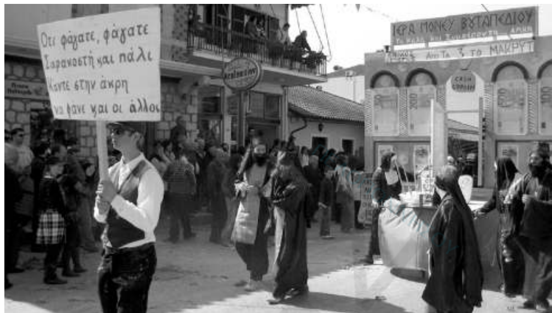
Ένα ακόμα επιτυχημένο θέμα τα εκκλησιαστικά