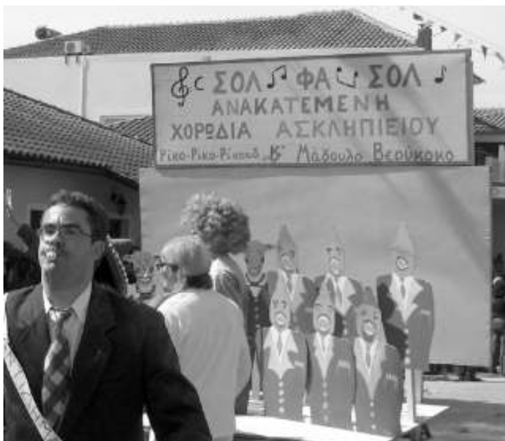
Ακόμα και η Δημοτική Χορωδία Ασκληπείου σατιρίστηκε