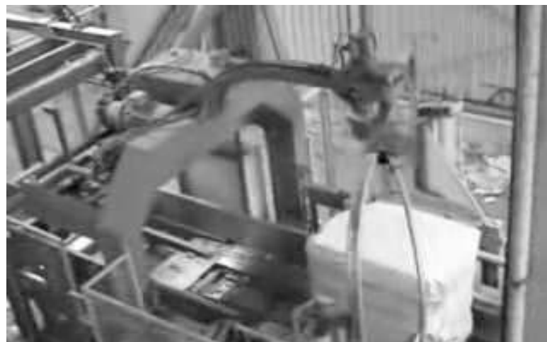
Αυτά είναι τα μηχανήματα δεματοποίησης που παρουσιάζει αποκλειστικά σήμερα στην Αργολίδα ο «α»

άστηκε. Ανέφερε ότι με τον Φορέα Διαχείρισης Στερεών Αποβλήτων Αρκαδίας συζήτησε προ καιρού και του ανέθεσαν όλοι οι δήμαρχοι που συμμετέχουν στο διοικητικό του όργανο την ευθύνη υλοποίησης του σχεδιασμού αυτού που τώρα υλοποιείται, με την εγκατάσταση στη ΒΙΠΕ του δεματοποιητή και στον Αχλαδοκάμπο του χώρου απόθεσης των δεμάτων, ενώ είναι διαθέσιμος