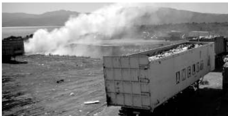
Η φωτιά μάλιστα ανεξέλεγκτη επί ώρες και κανείς υπάρχει εκεί για να την κατασβέσει

Και μπορεί από την πλευρά τους οι δήμοι να αδιαφορούν προκλητικά και να πληρώνουν μάλιστα αδρά εργολάβους για να πετούν ανεξέλεγκτα τα σκουπίδια, όμως με την πίεση της περιφέρειας αρχίζει να φαίνεται κάποιο φως στον ορίζοντα, εν όψει των τσουκτερών προστίμων που θα αρχίσουν να πέφτουν σαν βροχή από την 1η Ιανουαρίου του νέου έτους. Όπως τονίζει ο περιφερειάρχης κος