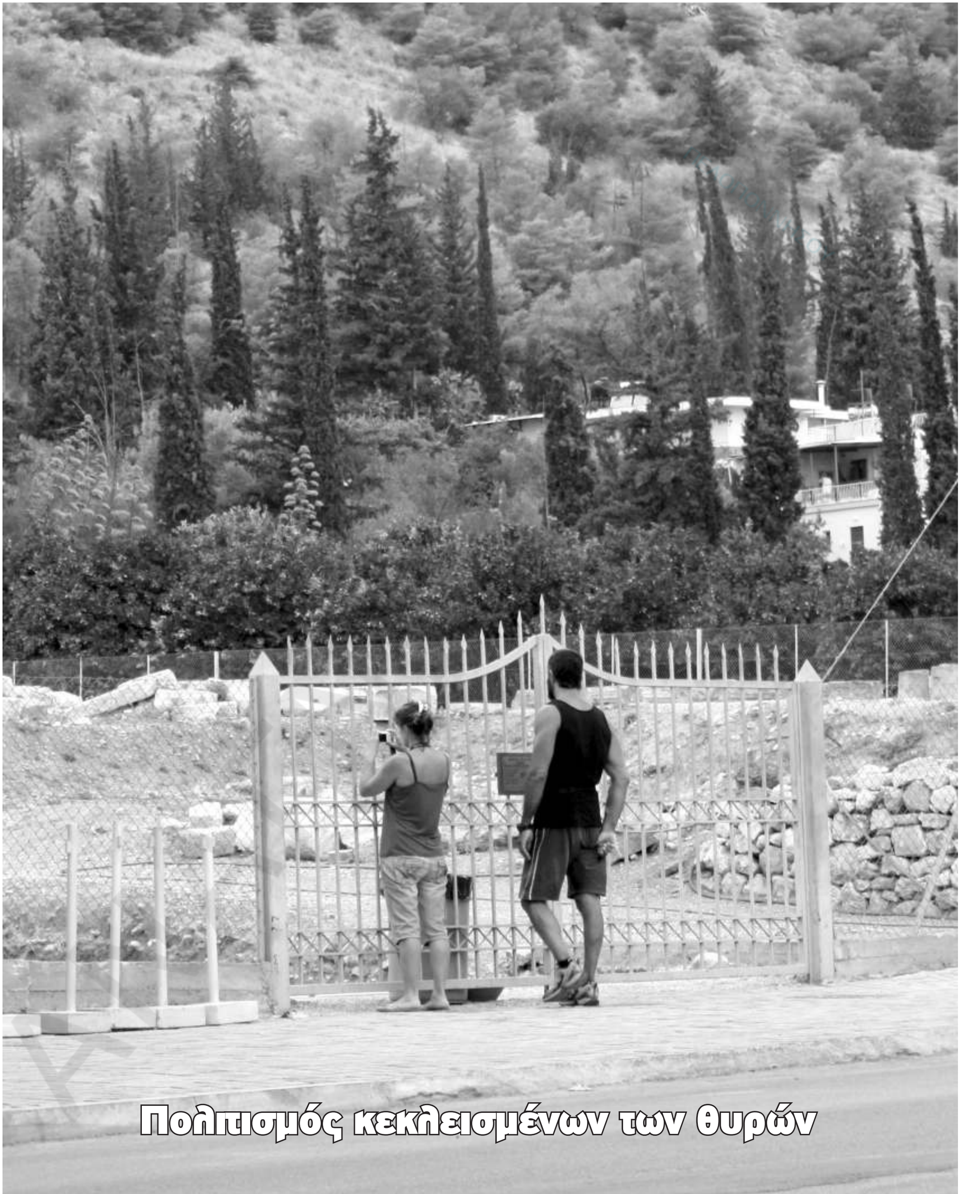
Πομπισμός κεκλεισμένων των θυρών