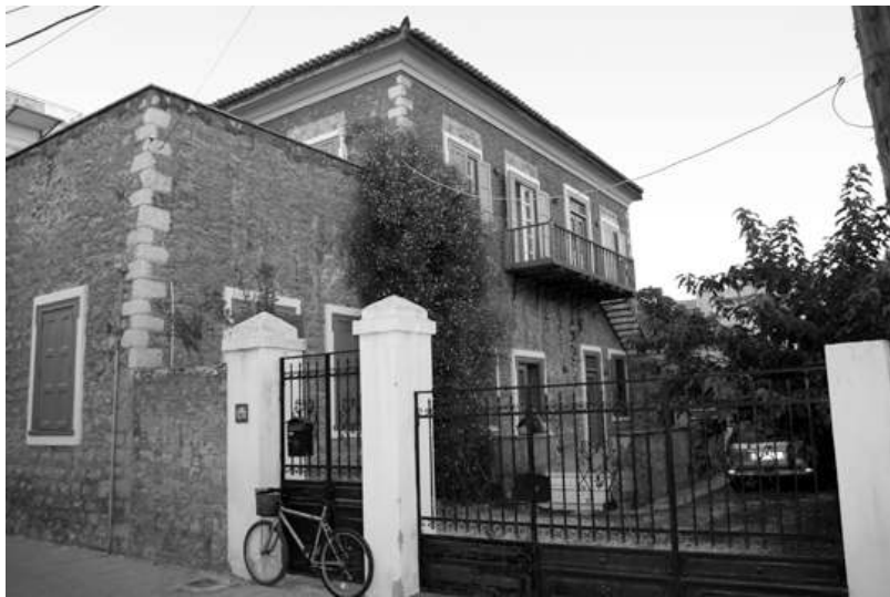
Γαλλική Αρχαιολογική σχολή