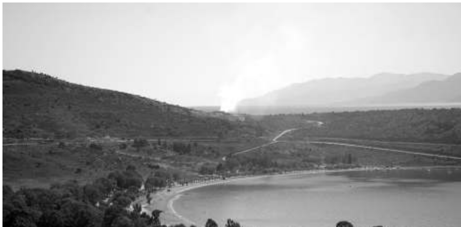
Η φωτιά της Δευτέρας στην τουριστική Καραθώνα, πάνω από την παραλία που κάνουν μπάνιο οι δημότες του Ναυπλίου