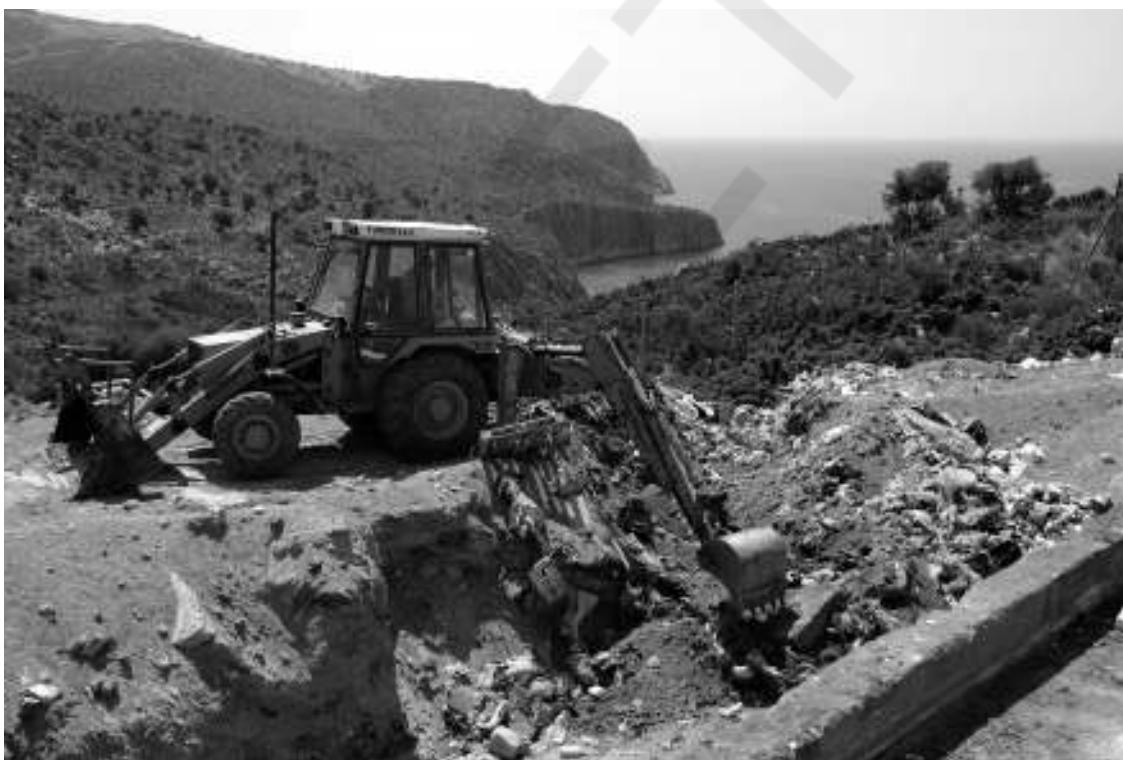
Ανασύραμε από το αρχείο την φωτογραφία αυτή. Για περισσότερα από δύο χρόνια τα σκουπίδια φτάνουν στην Καραθώνα και κανείς δεν συγκινείται.

Την ίδια ώρα στο μπλογκ της Οικολογικής Εναλλακτικής Παρέμβασης Ερμιονίδας, βλέπαμε ανάλογες φωτογραφίες από φωτιά που είχε ξεσπάσει στα σκουπίδια που πετάγονται στα Δισκούρια της Ερμιονίδας. Και όπως σημειώνεται σε παλιότερο πόστ του μπλογκ της Παρέμβασης «μια γενιά παιδιών τουλάχιστον γεννήθηκε, μεγάλωσε, εικοσάρισε, αναπνέοντας την καρκινογόνα διοξίνη από την καύση των σκουπιδιών. Όχι δεν σκορπίζει στον αέρα. Ανάλογα με το που φυσά