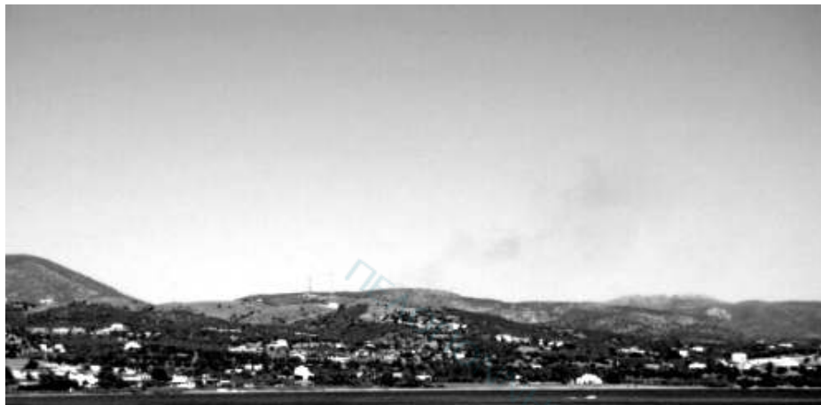
Η φωτιά στα Δισκούρια από την καύση των σκουπιδιών

Καίγονται τα σκουπίδια στην Καραθώνα και στα Δισκούρια, την ώρα που ο Αγγελόπουλος προσπαθεί να σώσει τους δήμους από τα τσουκτερά πρόστιμα