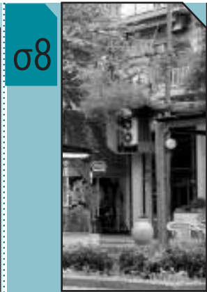
Χτύπησαν οι "Ρομπέν"